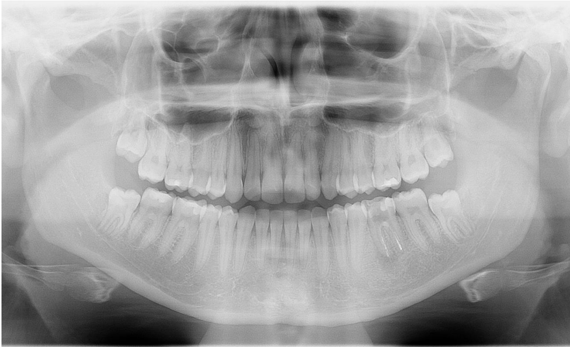
Slika 2. Ortopantomogram prije zahvata

Pacijentica je lokalno anestetizirana provodnom anestezijom donjeg alveolarnog živca i provodnom anestezijom bukalnog živca. Nakon početka djelovanja anestezije, ekstrahira se donji lijevi prvi molar, a periapikalna lezija očisti se kohleom. Zatim se pristupa ekstrakciji donjeg lijevog trećeg molara (donorskog zuba). Napravi se horizontalna incizija na hrptu alveolarnog grebena od uzlaznog kraka mandibule do distalne plohe drugog molara koja se nastavi u sulkus drugog molara s vestibularne strane te se time prikaže kruna trećeg molara.