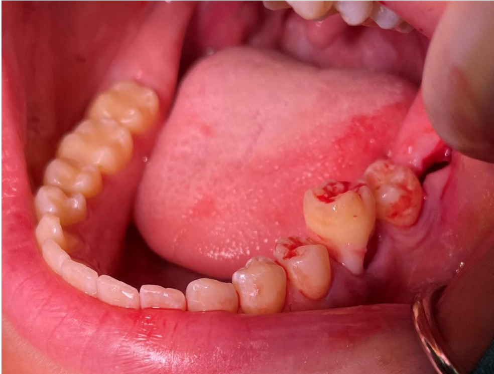
Slika 4. Položaj trećeg molara u postekstrakcijskoj alveoli prvog molara prije njena oblikovanja

Primateljska alveola prvog molara oblikuje se okruglim kirurškim svrdlom s vodenim hlađenjem na maloj brzini. Alveola mora biti dovoljno velika da omogući postavljanje zuba donora u nju bez primjene pritiska. Za to se vrijeme zub donor čuva u fiziološkoj otopini kako bi se očuvala vitalnost stanica parodontnog ligamenta.