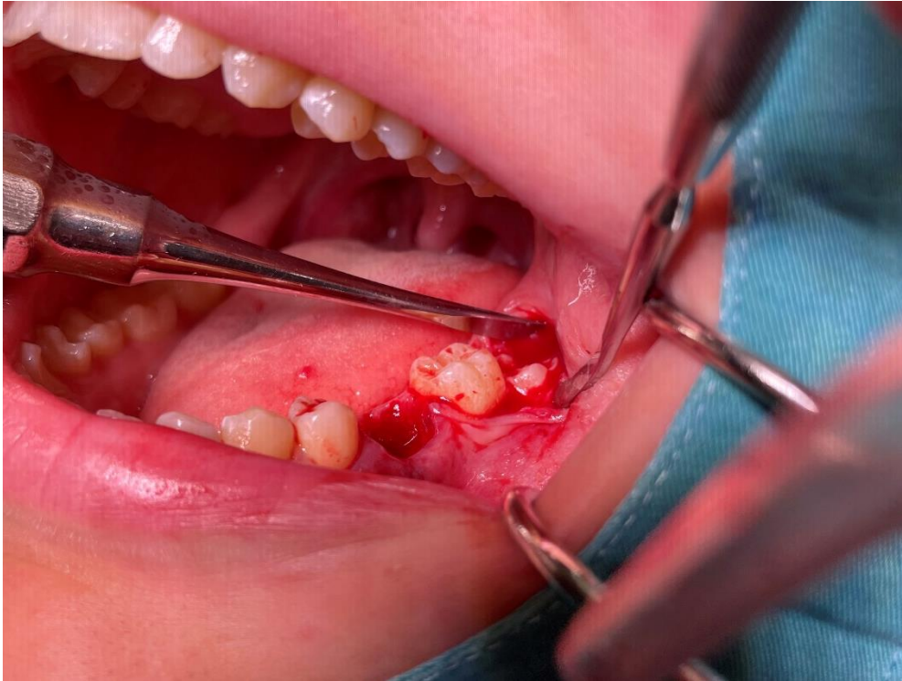
Slika 3. Ekstrahiran prvi molar i prikazana kruna trećeg molara

Treći se molar ekstrahira što više atraumatski kako bi se očuvale stanice parodontnog ligamenta. Pokuša se odmah smjestiti u post-ekstrakcijsku alveolu prvog molara, ali ne sjeda, te je potrebno kirurški proširiti alveolu kako bi se omogućila adekvatna adaptacija zuba.