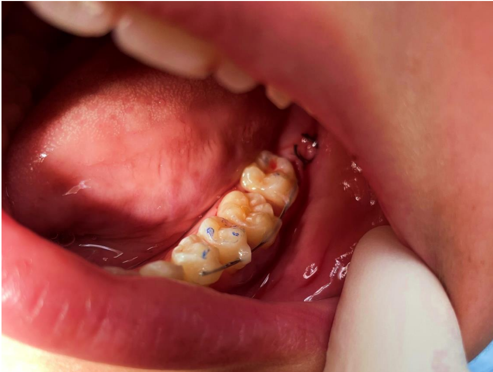
Slika 7. Zub donor u infraokluziji stabiliziran kompozitno-žičanim splintom

Nakon što je zub donor uspješno postavljen u primateljsku alveolu, incizija u području trećeg molara zašije se pojedinačnim šavovima. Zub donor stabilizira se kompozitno-žičanim splintom za susjedne zube. Splint se uklanja nakon dva tjedna kako bi se spriječila ankiloza. Zub se nalazi u infraokluziji te se očekuje njegovo izrastanje u pravilnu okluziju tijekom sljedećih nekoliko mjeseci.