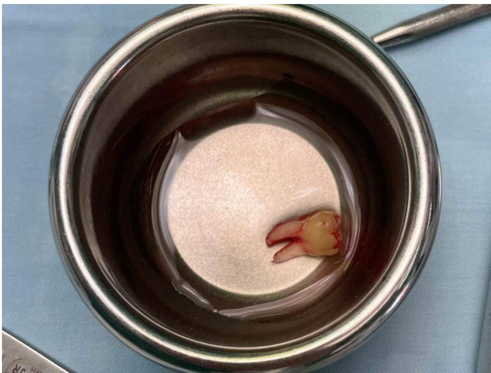
Slika 5. Zub donor u fiziološkoj otopini