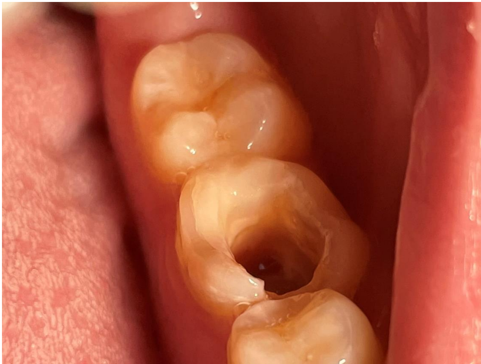
Slika 1. Klinički prikaz molarne regije dolje lijevo

Pacijentica u dobi od 19 godina upućena je na Zavod za oralnu kirurgiju sa Zavoda za endodonciju i restaurativnu dentalnu medicinu Stomatološkog fakulteta Sveučilišta u Zagrebu zbog nemogućnosti endodontskog liječenja donjeg lijevog prvog molara. Medicinska je anamneza pacijentice bez osobitosti. Kliničkim pregledom vidljiv je donji lijevi prvi molar s trepanacijskim otvorom koji se nije mogao zatvoriti zbog supuracije i bolova te nedostatak donjeg lijevog trećeg molara u usnoj šupljini. Na ortopantomogramu je vidljiv ekstenzivni periapikalni proces u području donjeg lijevog prvog molara te je zato indiciran za ekstrakciju. Također je vidljiv neizniknuti donji lijevi treći molar pravilnog morfološkog oblika sličnog prvom molaru, s otvorenim apeksima na oba korijena, što ga čini pogodnim za autotransplantaciju na mjesto prvog molara.