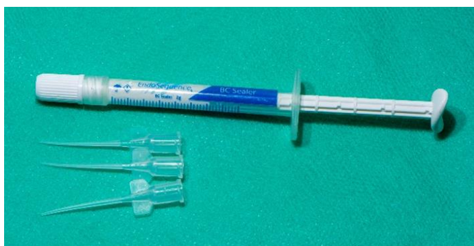
Slika 14. EndoSequence biokeramičko punilo korijenskih kanala. Preuzeto s dopuštenjem autora: prof. dr. sc. Ivice Anića.