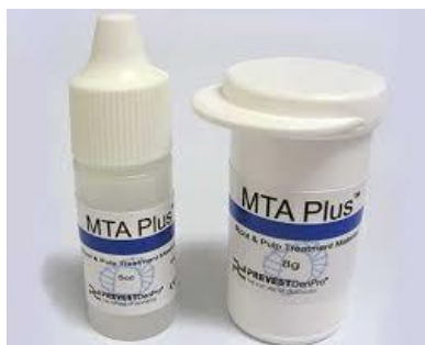
Slika 5. MTA Plus. Preuzeto: (31).

na 1052 minute. Tlačna čvrstoća je bitno manja u usporedbi s MTA Plus-om (slika 5), (30).