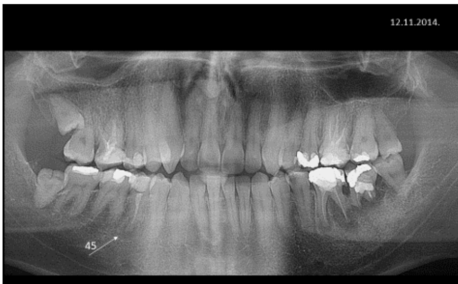
Slika 8. Ortopantomogram čeljusti. Na zubu 45 vidljivo je nepotpuno punjenje korijenskog kanala i patološko prosvjetljenje periradikularnog tkiva.