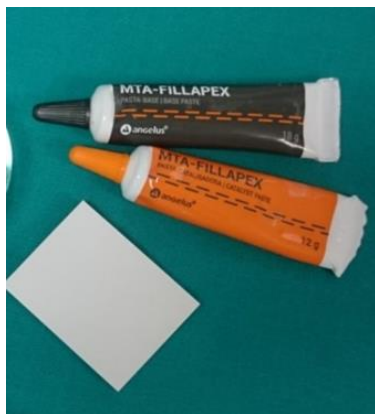
Slika 12. MTA-Fillapex.