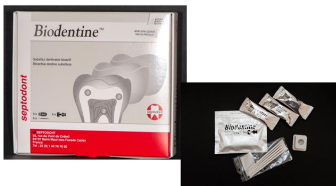
Slika 1. Biodentin (Septodont)

skupine materijala su trikalcij-silikati te kalcij-fosfati (5). Prvi biokeramički materijal uspješno upotrijebljen u endodontskom liječenju bio je mineral trioksid agregat (MTA, eng. mineral trioxide aggregate) cement u Kaliforniji (SAD) 1993. godine. Prvotna namjena bila mu je retrogradno punjenje korijenskih kanala te zatvaranje perforacija korijena zuba (6). Danas, osim MTA-a, na tržištu su i drugi biokompatibilni materijali kao što su: ProRoot MTA, Biodentine (slike 1 i 2), Endosequence BC sealer, Bioaggregate te Generex A (7).