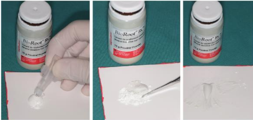
Slika 7. način miješanja praha i tekućine BioRoot RCS biokeramičkog materijala .