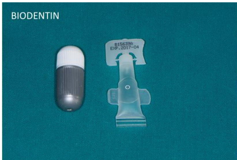
Slika 2. Pakiranje praha i tekućine biokeramičkog materijala »Biodentin«, Septodont.

Iako su svojstva tih materijala potaknula njihovu primjenu u dentalnoj medicini, upotreba biokeramičkih proizvoda još uvijek je česta te komercijalni materijali nisu poznati većini današnjih doktora dentalne medicine.