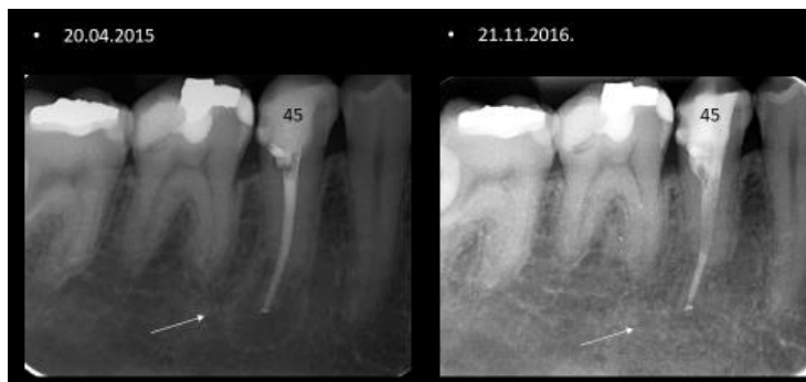
Slika 9. Na zubu 45 napravljena je revizija punjenja i korijenski kanal ispunjen je biokeramičkim materijalom (BioRoot) i gutaperkom. Nakon godine i pol vidljivo je cijeljenje periradikularne lezije na zubu 45.