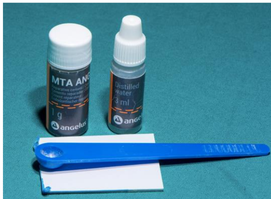
Slika 4. MTA Angelus biokeramika.