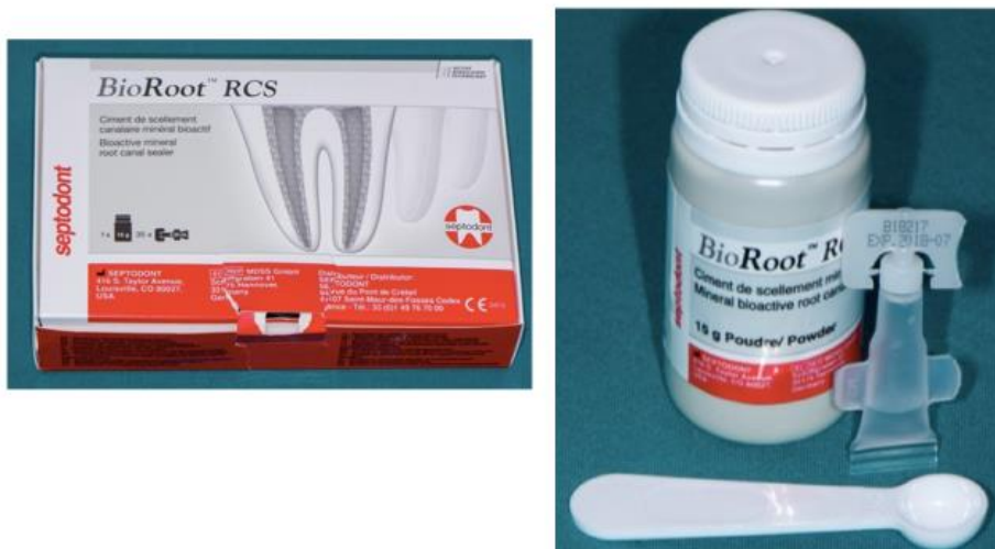
Slika 6. BioRoot RCS, biokeramički materijal za punjenje korijenskih kanala zuba.

Endodontska biokeramika nije osjetljiva na kontaminaciju vlagom ili krvlju i nije osjetljiva na tehniku kojom se koristi. Dimenzijski je stabilna, ali malo expandira tijekom stvrdnjavanja. Tvrdna je i netopljiva, a zbog hidratacijske reakcije ima visoki pH 12. Stvoreni kalcijev hidroksid se kasnije disocira na kalcijeve i hidroksilne ione. Zbog visokog pH i posljedičnog antibakterijskog učinka, u kliničkoj primjeni može potaknuti cijeljenje tkiva nakon endodontskog zahvata (slike 7,8,9)