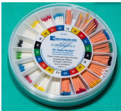
Slika 13. EndoSequence gutaperke obložene nano česticama biokeramike. Preuzeto s dopuštenjem autora: prof. dr. sc. Ivice Anića.

Endosequence (Brassler USA, Savannah, GA, USA), (slike 13 i 14) je materijal napravljen za trajno punjenje kanala s dužim vremenom rukovanja te kraćim vremenom stvrdnjavanja. Sadrži kalcij-silikate, cirkonijeve okside te tantalov oksid. Pojavljuje se pod različitim imenima, ovisno o državi proizvodnje (Iroot injectable sealer i iRoot BP u Kanadi te TotalFill u Švicarskoj). Oblici u kojima dolazi mogu biti više tekući te se injektirati u kanal, a TotalFill Putty je u obliku paste koja se oblikuje prema želji, unosi se i utiskuje u kanale. Vrijeme stvrdnjavanja je otprilike dva sata za injektabilne oblike punila, a 20 minuta za TotalFill Fast-Set Putty (41).