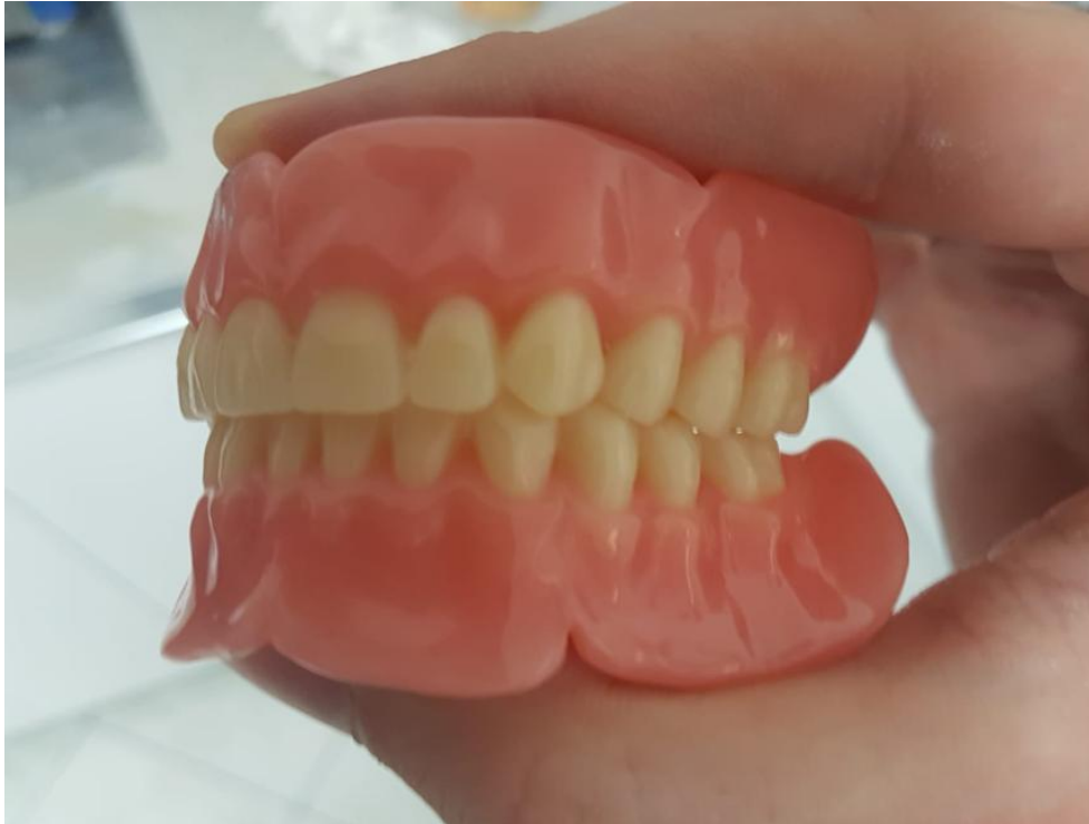
Slika 10. Obradene i polirane proteze

Imedijatnu protezu koja je obrađena i polirana stomatolog treba pažljivo pregledati i ukloniti sva moguća oštra mjesta frezom. Estetski izgled, visina okluzije i okluzijski odnosi ispituju se u pacijentovim ustima. No, prije stavljanja u usta proteza se pere sapunicom i na jedan sat uranja u rastvor dezinfekcijskog sredstva (Slika 10.).