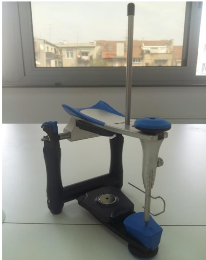
Slika 8. Artikulator

Artikulatori su mehaničke naprave koje služe za što točniju i individualniju reprodukciju kretnji mandibule i odnosa među čeljustima (Slika 8.). Prema tipu konstrukcije dijelimo ih na arcon i non-arcon artikulare. Kod arcon artikulatora gornji član oponaša zglobnu jamicu temporomandibularnog zgloba, a donji član kondil. Kod non-arcon artikulatora taj je položaj obrnut. Prema stupnju složenosti i svrsi upotrebe podijelili smo ih na jednostavne-neprilagodljive, poluprilagodljive i potpuno prilagodljive artikulare. Najširu upotrebu imaju poluprilagodljivi artikulatori (26).