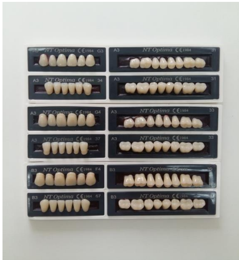
Slika 1. Različiti oblici, veličine i boje umjetnih zuba

Postavljanjem proteze u pacijentova usta neposredno nakon vađenja zuba sprječava se kolaps usnica i obraza. Stoga je estetska vrijednost imedijatne proteze velika. Važno je naglasiti i psihološku sigurnost koju ona pruža jer se izbjegava razdoblje bezubosti, što omogućuje nesmetanu poslovnu i društvenu aktivnost (7).