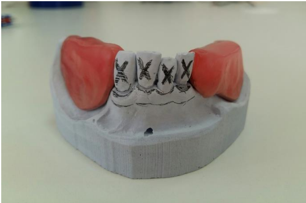
Slika 9. Povučena linija po marginalnoj gingivi

Ako preostali prirodni zubi imaju duboke džepove, u pacijentovim ustima ta se dubina ispita te se na modelu označi marginalna gingiva i radirana mjesta koja označavaju dubinu džepova (1). Svrdlom, pilicom za gips, montiranim kamenom ili čeličnom frezom režu se sadreni zubi do razine marginalne gingive. Odstranjuje se jedan po jedan zub i postavlja odgovarajući umjetni zub.