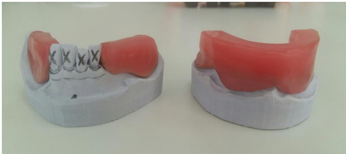
Slika 7. Gornja i donja probna baza

Međučeljusni odnosi određuju se pomoću probnih baza koje se izrađuju na radnom modelu. Probne baze ne smiju se pomaknuti za vrijeme određivanja međučeljusnih odnosa, moraju prekriti ležište i naslanjati se na preostale zube (Slika 7.). Da bi se postigla bolja retencija, moguće je postaviti i kvačice (2). Određivanje međučeljusnih odnosa jednostavnije je ako u objema čeljustima postoje zubi koji osiguravaju taj odnos, prije svega to se odnosi na sačuvane prve premolare. Tamo gdje su očuvani samo prednji zubi, visina okluzije ne postoji, stoga ju je potrebno odrediti kao kod potpune bezubosti (1).