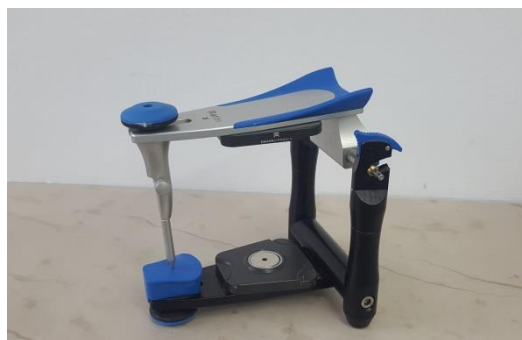
Slika 4. Artikulator