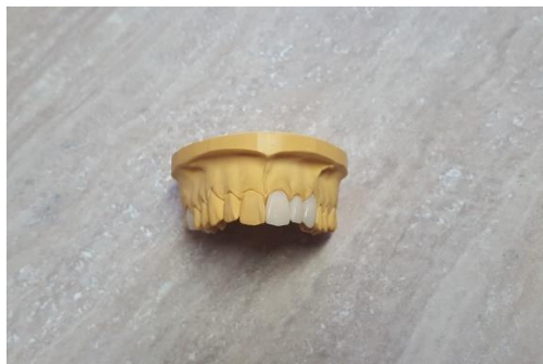
Slika 2. Privremene poliamidne krunice