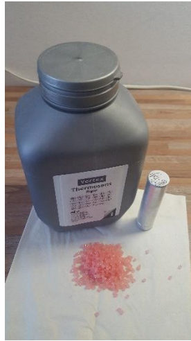
Slika 7. Poliamidni materijal i kartuša

U isto vrijeme se zagrijavaju i kivete tijekom 15 minuta u vodi na temperaturi od 90 °C, iz koje se vade 2 minute prije injekcije. Potrebno ih je osušiti i sadru premazati izolacijskim sredstvom prikladnim za injekcijsku tehniku. Ne smije se koristiti lak na bazi alginata jer on tijekom injekcijskog procesa sagorijeva, što ima negativni učinak na krajnji rezultat.