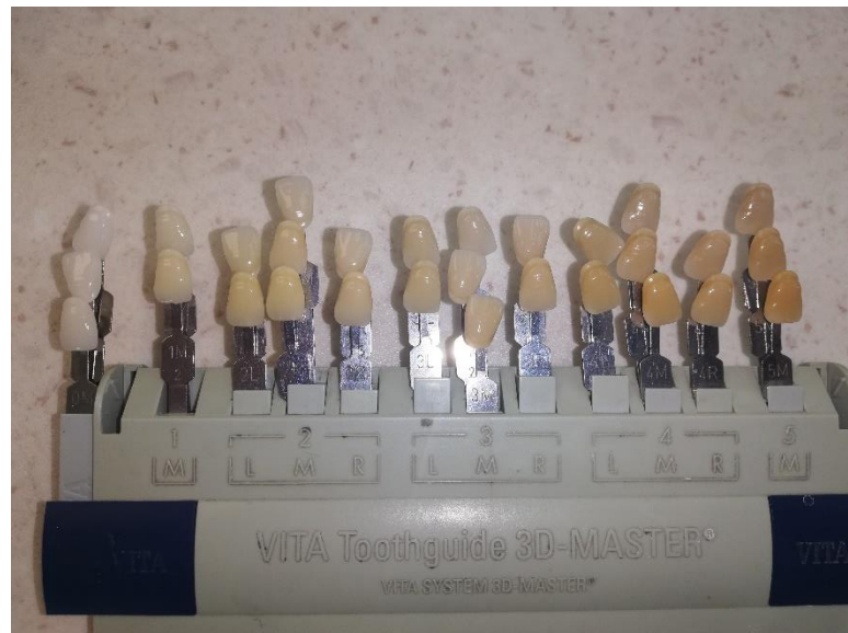
Slika 4. Ključ boja

Boja umjetnih zuba odabire se pri dnevnome svjetlu pomoću ključa boja, a treba biti usklađena s bojom očiju, kose i kože te s dobi pacijenta. Također je važno osvjetljenje, kut promatranja, promatračeva temeljna sposobnost razlikovanja boja i njegovo iskustvo. Ova je metoda subjektivna i ovisi o ograničenjima ključa boja (Slika 4.).