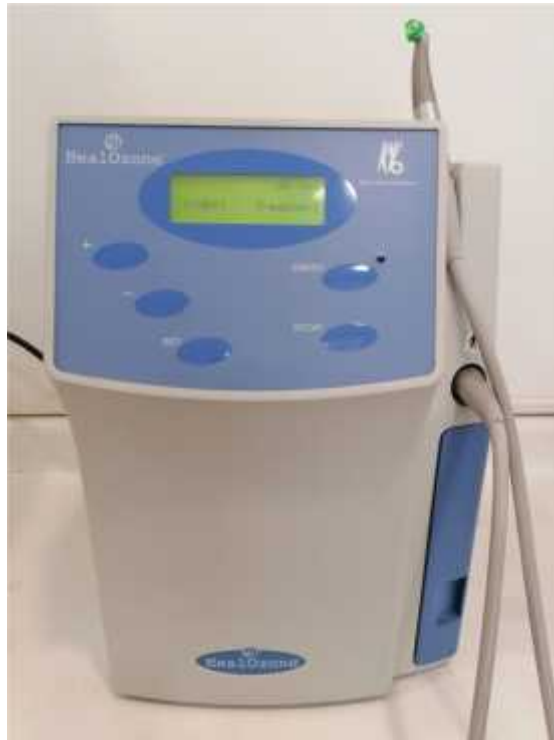
Slika 1. Generator ozona HealOzone (KaVo Dental GmbH, Germany).