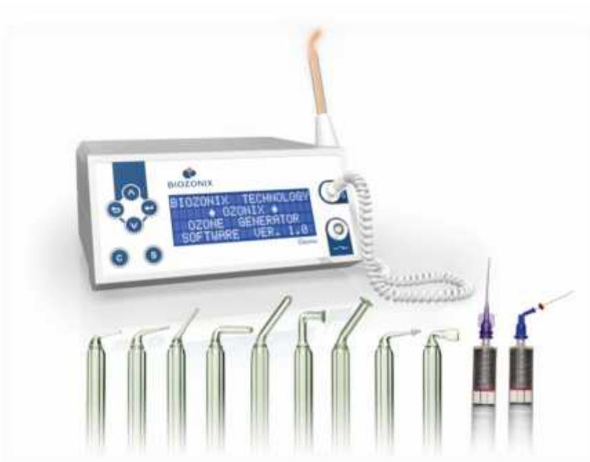
Slika 2. Generator ozona Ozonix (Biozonix, München, Deutschland).