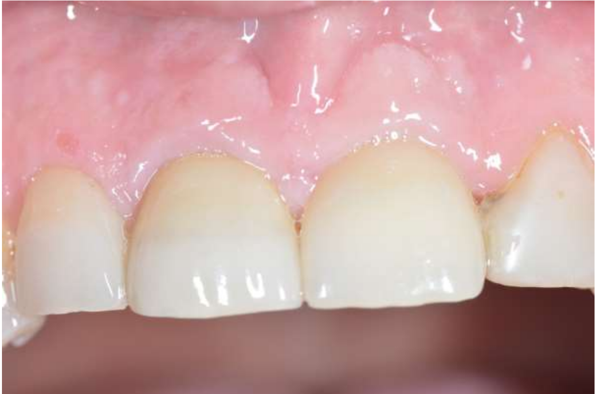
Slika 5. Izgled konačnog protetskog rada. Vidljiv je uredan izgled periimplantatnog tkiva i zacijeljena sluznica.