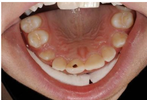
Slika 6. Pristupni kavitet.

Instrumentacija se ne provodi. Uklanjanje nekrotične pulpe postiže se isključivo laganom irigacijom s NaOCl, jer ima svojstvo otapanja tkiva i snažno antimikrobno djelovanje (Slika 7).