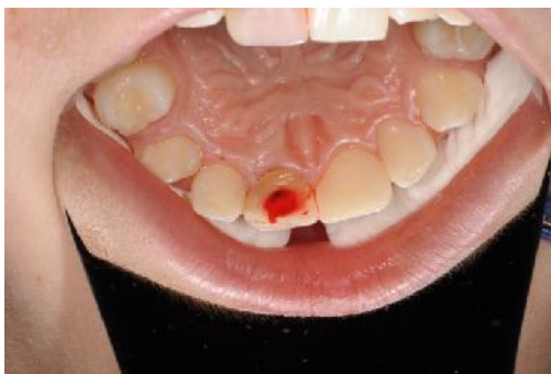
Slika 12. Krvarenje periapikalnog područja u korijenski kanal.

Potrebno je 15 minuta da se stvori krvni ugrušak (7) (Slika 13).