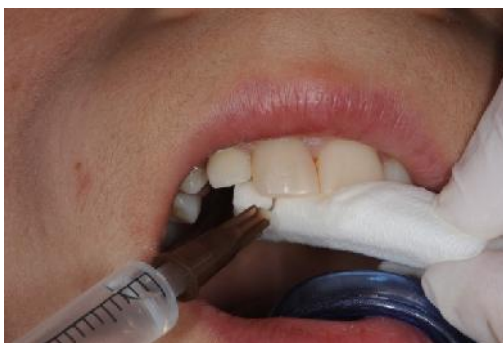
Slika 7. Irigacija korijenskog kanala s NaOCl.

Instrumentacija se ne provodi. Uklanjanje nekrotične pulpe postiže se isključivo laganom irigacijom s NaOCl, jer ima svojstvo otapanja tkiva i snažno antimikrobno djelovanje (Slika 7).