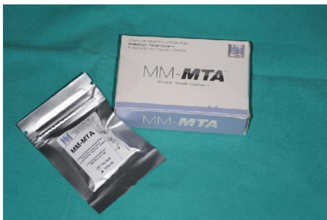
Slika 3. Mineral trioksid agregat (MTA)

Dvostruka aplikacija MTA u pristupni kavitet ispod CCS se pokazala kao odlično brtvilo. Postavljanje MTA stvara jaku barijeru bakterijama i u kontaktu s krvnim ugruškom stimulira signalne molekule na rast matičnih stanica (20).