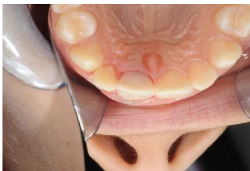
Slika 16. Postendodontska opskrba zuba.

Pojedini autori ostavljaju vaticu i privremeni ispun i do 2 tjedna. Nakon uklanjanja istog, može se dogoditi da je MTA smješten malo apikalnije. U tom slu aju prazan dio kanala treba ispuniti nekom od termoplasti nih tehnika punjenja korijenskog kanala (npr. Obtura II) (2).