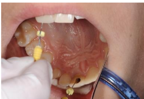
Slika 11. Poticanje krvarenja.

Kada krv približno dosegne razinu caklinsko-cementnog spojišta (CCS), postavi se sterilna kuglica vatice u koronarnu trećinu kanala (Slika 12).