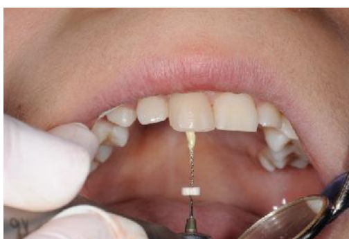
Slika 9. Aplikacija trostruke antibiotske paste (TAP) u korijenski kanal s lentulo spiralom.