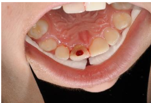
Slika 13. Formiranje intrakanalnog uzgruška.

Potrebno je 15 minuta da se stvori krvni ugrušak (7) (Slika 13).