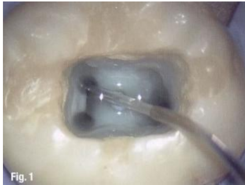
Slika 2. Toluenski klorid u sustavu kanala mandibularnog molara. Primijetite laserski nastavak (isklju en) u kanalu.

spajanjem s polilizinskim polimerom, koji ima afinitet za stani nu stijenku bakterije (10).