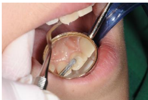
Slika 10. Izrada privremenog SIC ispuna.