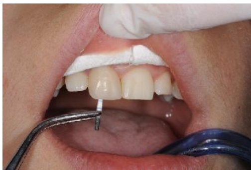
Slika 8. Sušenje korijenskog kanala papirnatim štapićem (paper point).

Inicijalno ispiranje NaOCl se nastavlja s ispiranjem 5 ml fiziološke otopine (0.9% NaCl), kako bi se izbjeglo stvaranje neželjenog naranasto-smeđeg precipitata para-kloranilina (PCA), koji nastaje reakcijom NaOCl i CHX, a time i diskoloracija zuba u smeđu boju. Osim toga, pokazalo se da je precipitat citotoksičan i zatvara ulaze u dentinske tubuluse (3, 22). Završno ispiranje se izvodi s 10 ml 2% CHX. CHX se koristi kao završni irigans, jer ima snažno antibakterijsko djelovanje i supstantivan je. Prilikom irigacije s NaOCl, treba paziti da igla stoji labavo u kanalu i da se irigans aplicira polagano. Igla bi trebala biti u kanalu postavljena 2 mm kraće od apeksnog otvora. Radna duljina se odredi korištenjem RTG snimke (2-3 mm kraće od apeksa) (6). Treba paziti da agensi ostanu isključivo unutar kanala. Korijski kanal se suši korištenjem sterilnih papirnatih štapića (paper points) (3) (Slika 8).