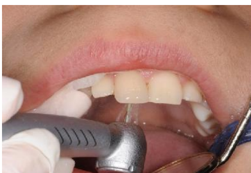
Slika 5. Izrada pristupnog kaviteta.