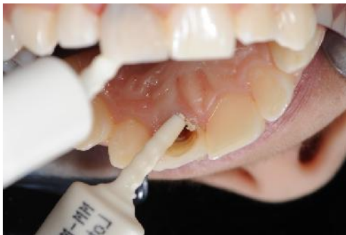
Slika 14. Aplikacija mineral trioksid agregata (MTA) u korijenski kanal.