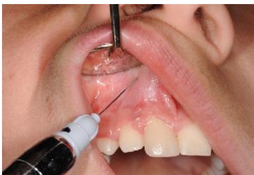
Slika 4. Lokalna anestezija.