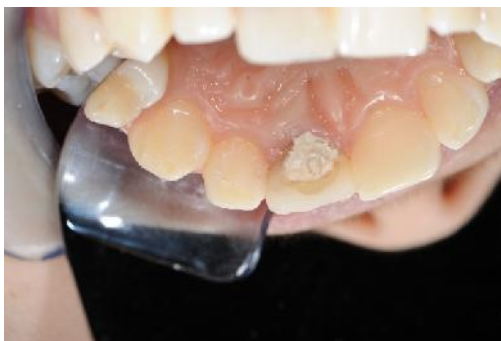
Slika 15. Kompakcija mineral trioksid agregata (MTA) u korijenski kanal.

Kompaktira se do 5 mm u korijenski kanal (Slika 15).