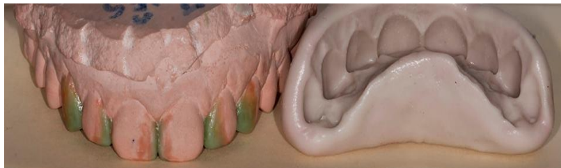
Slika 2. Model s wax up-om. Silikonski ključ.