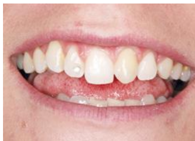
Slika 4. Početna situacija kod pacijentice. Preuzeto: (11)