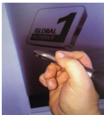
Slika 18. 3D intraoralni skener.

Govoreći o digitalnim otiscima važno je naglasiti sustave u sklopu kojih se koriste, a to su ordinacijski i laboratorijski sustavi (22). U ordinacijskim digitalnim sustavima kliničar nakon preparacije bataljaka 3D intraoralnim skenerima uzima otiske, zatim slijede faze softverskog dizajna istih te konačno faza glodanja (22). U laboratorijskim sustavima tijek je malo drugačiji. Uzimaju se konvencionalni otisci nakon čega se u tvrdoj sadri izljevaju radni modeli. Modeli se zatim skeniraju te slijedi softverski dizajn restauracije i glodanje (22).