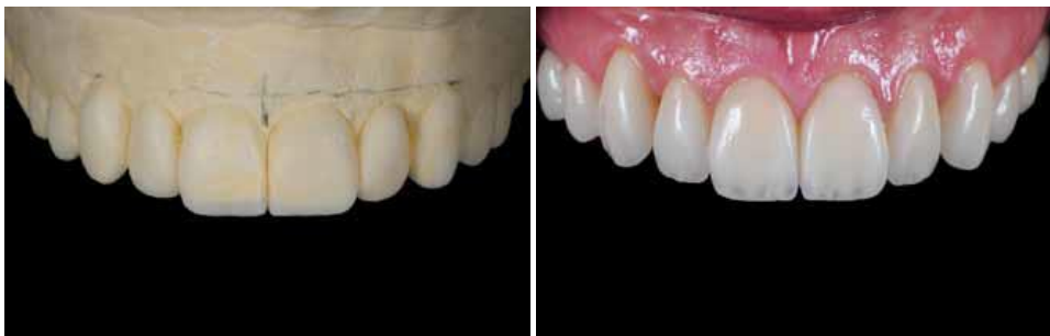
Slika 15. Dijagnostički wax up. Preuzeto: (14)