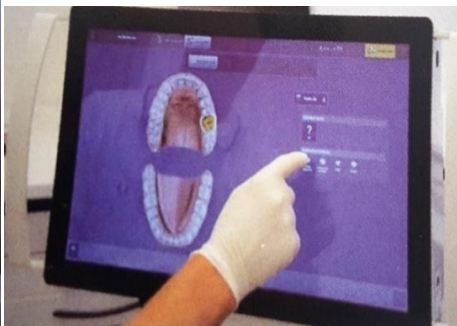
Slika 19. Skeniranje u ustima pacijenta i obilježavanje ruba preparacije. Preuzeto: (22)