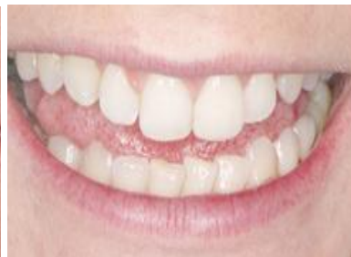
Slika 5. Mock up lijevog središnjeg sjekutića izrađen direktno kompozitnim materijalom. Preuzeto: (11)