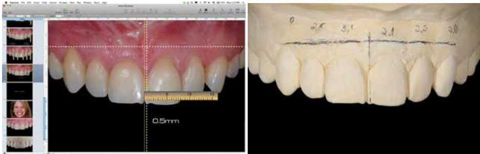
Slika 13. Mjerjenje neskladnosti između središnje linije lica i središnje dentalne linije. Preuzeto: (14)