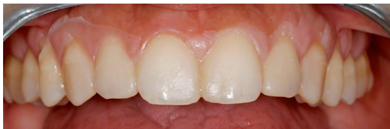
Slika 3. Mock up gornjih prednji zubi dobiven silikonskim ključem ispunjenim autopolimerizirajućom smolom i otisnutim preko zubi.