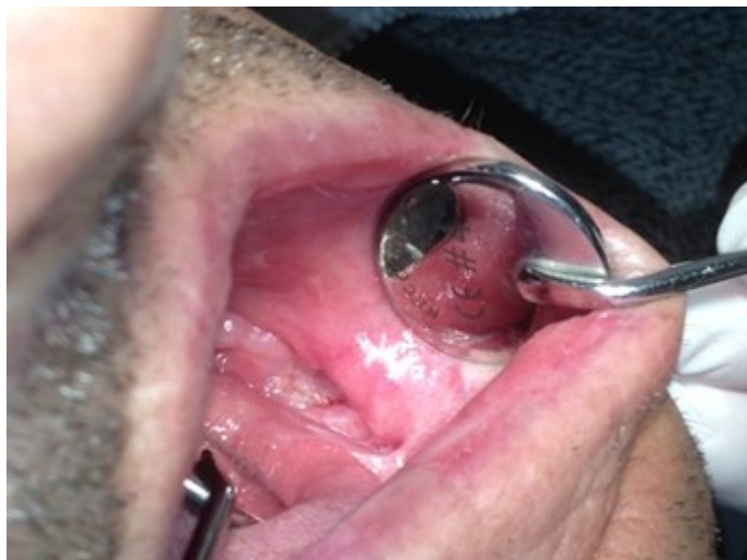
Slika 6. Klinički nalaz mjesec danas nakon provedene terapije