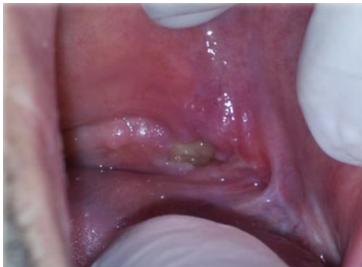
Slika 4. Klinički prikaz osteonekroze donje čeljusti