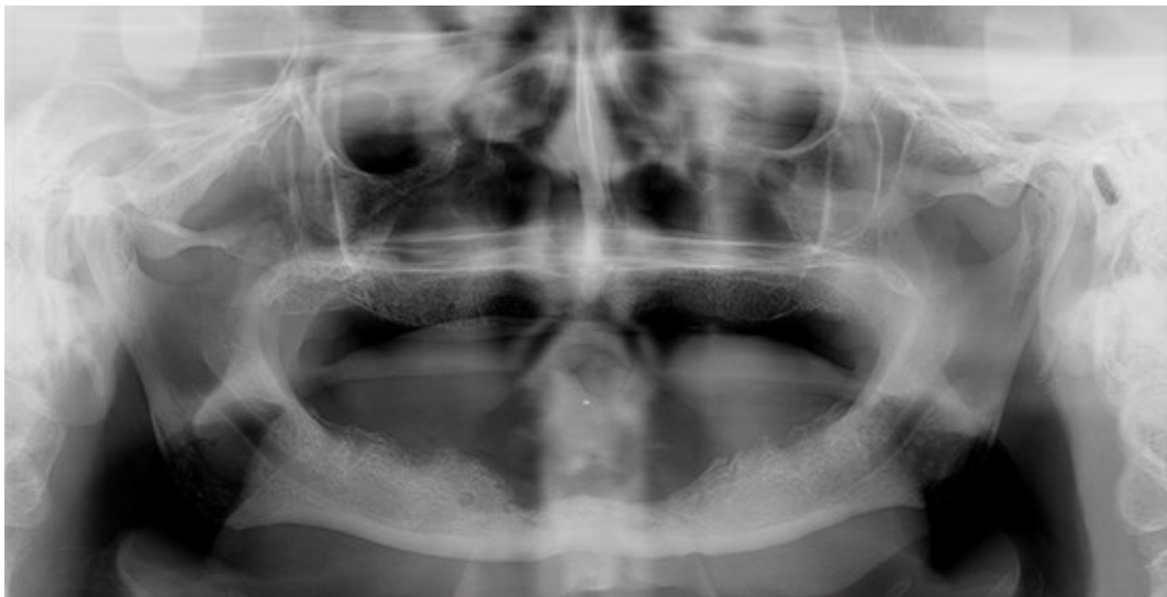
Slika 3. Radiološki nalaz pacijenta nakon provedene kirurške i radiološke terapije