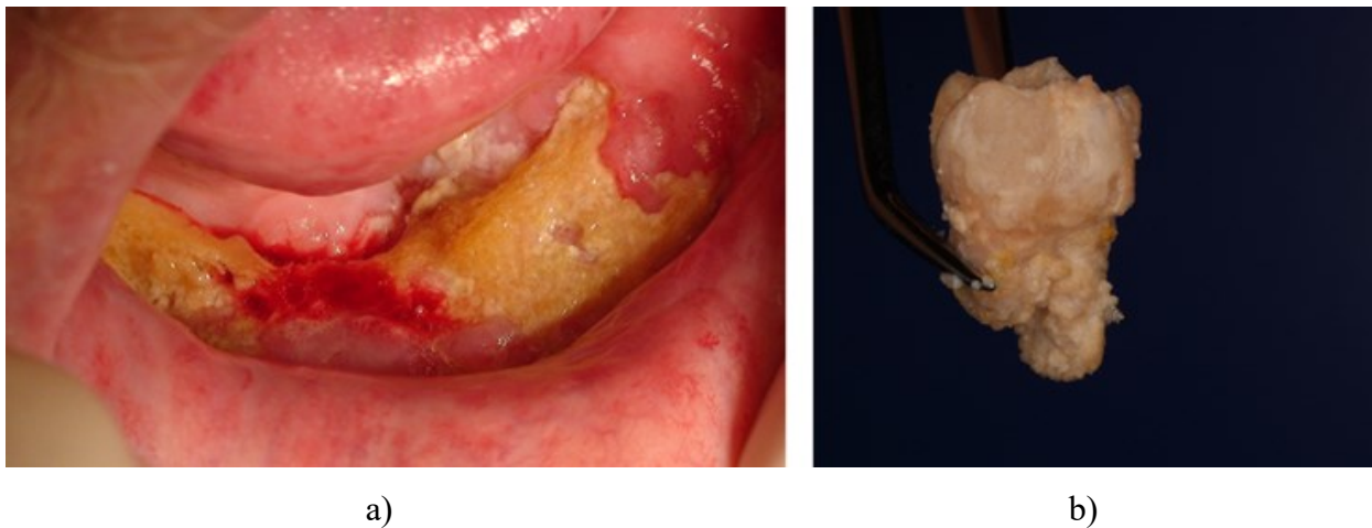
Slika 1. Klinički nalaz medikamentozne osteonekroze čeljusti (a), zub 47 odstranjen pincetom iz potpuno destruirane alveole donje čeljusti (b)

Za drugi stadij karakteristična je pojava eksponirane nekrotične kosti ili fistule koja se može sondirati do kosti uz prisutnost infekcije praćene simptomima poput boli, a može i ne mora biti prisutna supuracija. I kod ovih pacijenata radiološki znakovi mogu odgovarati nultom stadiju (7).