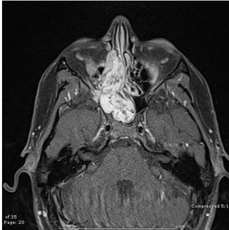
Slika 2. Juvenilni angiofibrom nazofarinksa. Preuzeto iz (14).

angiografija). Biopsija je kontraindicirana zbog obilna i za život opasna krvarenja (12).