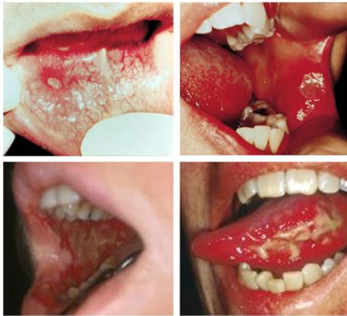
Slika 4. Oralni mukozitis. Preuzeto iz (18).