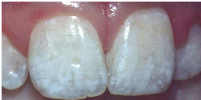
Slika 2. Dentalna fluoroza.

može varirati od bijele boje cakline kod blage forme fluoroze pa do žuto-smeđih ili čak smeđih diskoloracija kod jačih oblika (16).