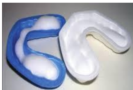
Slika 1. Žlica za fluoridaciju gelom. Preuzeto (16)

Redukcija karijesa seže od 40 do 75% (14). Gelovi (5000 - 12500 ppmF) se najčešće primjenjuju u konfekcijskim žlicama, a ne koriste se kod djece mlađe od 6 godina zbog opasnosti od gutanja. Vodice za ispiranje također se ne koriste kod djece mlađe od 6 godina, postoje s dnevnom ili tjednom koncentracijom fluorida te se koriste pod nadzorom (15).