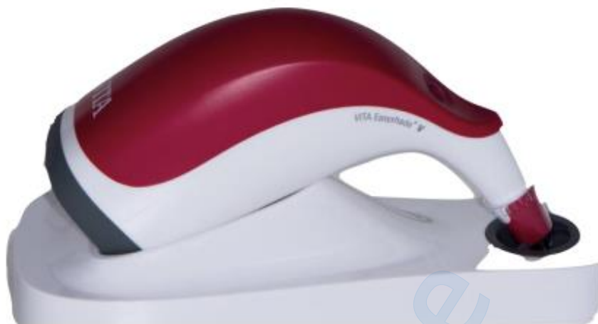
Slika 9. VITA Easyshade V na pločici za kalibraciju.