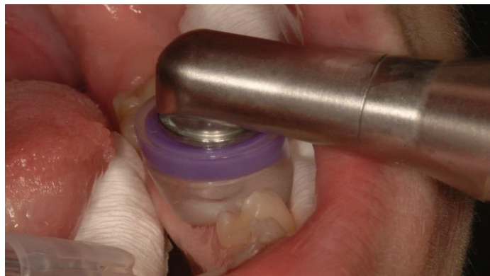
Slika 4. Primjena ozona u terapiji inicijalne karijesne lezije (Healozone (Kavo))