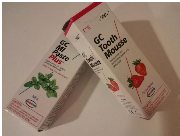
Slika 3. Tooth mousse (GC) i MI Plus Paste (GC)

Topikalne kreme dolaze na tržište pod tvorničkim nazivom Tooth Mousse (GC) i MI Plus Paste (GC) koja uz nanokompleks CPP-ACP sadržava i fluoridne ione (CPP-ACFP) (Slika 3.). Zbog sadržaja fluorida, a radi slabe kontrole ingestije ne primjenjuje se kod djece mlađe od šest godina, te prije izbjeljivanja. Osobito je indicirana kod sindroma suhih usta, refluksa želučanog sadržaja, bulimije te pacijenata u tijeku ortodontske terapije. Vrlo dobar klinički uspjeh postiže se i primjenom CPP-ACFP preparata za remineralizaciju rane karijesne lezije (20).