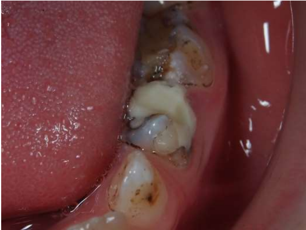
Slika 8. Konačni izgled ART ispuna.

Preuzeto s dopuštenjem autora: prof.dr.sc. Domagoj Glavina.