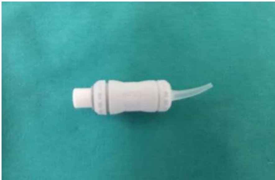
Slika 2. Kapsulirani oblik SIC-a omogućava stalan i točan omjer praha i tekućine te jednostavno i brzo unošenje u kavitet.