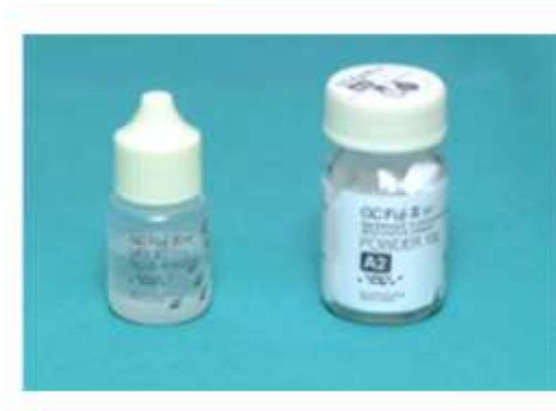
Slika 3. Konvencionalni SIC u obliku tekućine i praha.

Indikacije za uporabu konvencionalnih SIC-a su: podlaganje kaviteta, ispuni I., III. i V. razreda, pečačenje fisura i preventivni ispuni. Kao predstavnike ove skupine mogu se navesti Ketac Fil (3M ESPE), Fuji II (GC) i drugi (26,27).