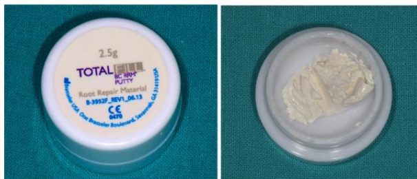
Slika 10. TotalFill biokeramička pasta za reparaciju stijenke korijenskih kanala i dentina.