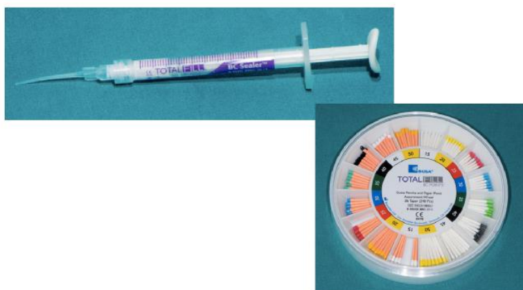
Slika 11. TotalFill biokeramičko punilo za korijenskih kanala zuba.