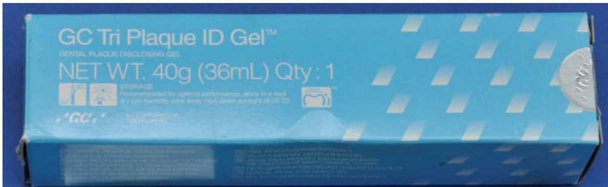
Slika 1. Primjer plak revelatora.

nastanak karijesa povećan (35). Testovi za određivanje pH vrijednosti sline i puferskih kapaciteta prikazani su na slici 4.