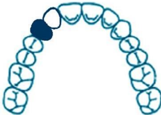
Slika 2. Privjesni most s očnjakom kao zubom nosačem, a međučlan je lateralni inciziv

Konačna odluka hoće li se most kojim nadomještamo jedan izgubljeni zub sidriti simetrično ili jednostrano dvostruko ovisi o tome koji će se zub brušenjem manje oštetiti. Bolje je brusiti nevitalan ili zub s multiplim ispunima, nego intaktan zub. Privjesni most s očnjakom kao zubom nosačem i lateralnim incizivom kao međučlanom prikazan je na slici 2.