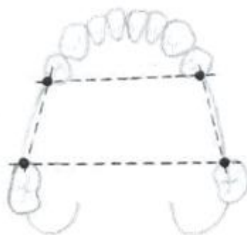
Slika 5. Poligonalno podupiranje djelomične proteze