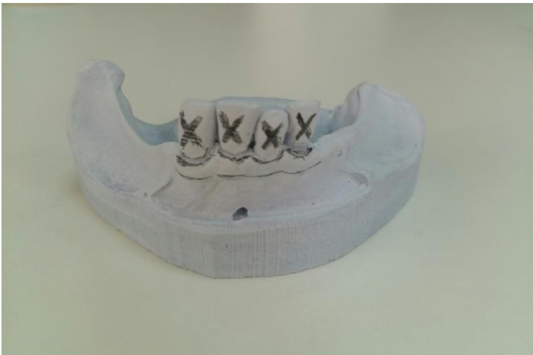
Slika 6. Radni model

Budući da je funkcijski otisak završen, odabire se konfekcijska žlica odgovarajuće veličine. Bitno je da prekriva individualnu žlicu koja se vraća u pacijentova usta. Konfekcijska se žlica puni alginatom, postavlja se preko individualne žlice i preostalih zuba. Nakon stvrdnjavanja alginata žlica se zajedno s funkcijskim otiskom vadi iz pacijentovih usta (1). U tako dobivenom otisku izlijeva se radni model u tvrdom gipsu te se na njemu provode daljnji postupci izrade proteze (Slika 6.).