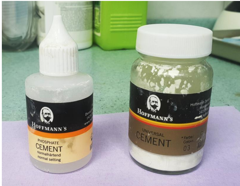
Slika 4. Cink-oksifosfatni trajni cement

mane koje pokazuje prilikom cementiranja na zube nosače, naročito vitalne, prilikom cementiranja u implantoprotetici jesu i prednosti. Topljiv je, što znači da se lako uklanja iz sulkusa oko implantata, a njegova kiselost koja može dovesti do devitalizacije zuba, u implantoprotetici nije važna (73,74).