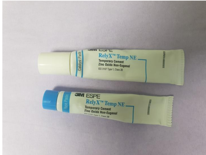
Slika 2. Privremeni cement na bazi cinkova oksida bez eugenola ( RelyXTemp NE , 3M ESPE)

Mogu se koristiti i kompozitni privremeni cementi koji se uglavnom rabe za cementiranje visokoestetskih radova u predjelu fronte gornje čeljusti zbog njihove translucencije. Prema kemijskom sastavu kompozitni privremeni cementi jesu: 56% dimetaakrilati, 43% punila, a ostatak čine pigmenti, stabilizatori i katalizatori. Jednostavni su za rukovanje i čišćenje. Najnovija skupina privremenih cemenata jesu adicijski silikoni s cinkovim oksidom. Po sastavu su polidimetilsiloksan i cinkov oksid. Dolaze u automix obliku i sastoje se od dviju pasta. Odlikuju se jednostavnom aplikacijom i čišćenjem (73, 77).