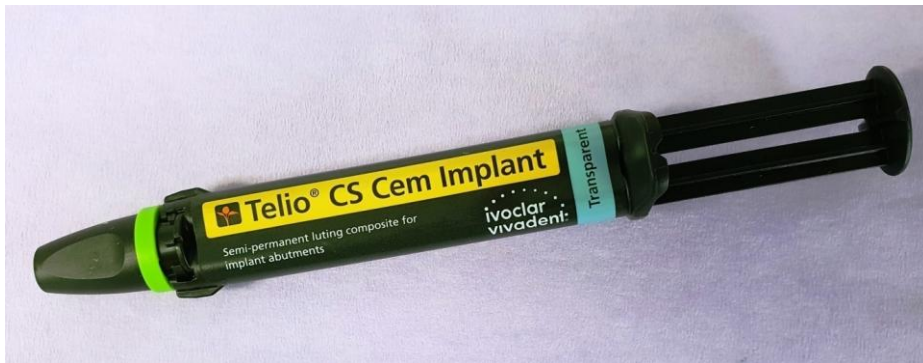
Slika 3. Privremeni cement za dulji period uporabe ( Telio CS CemImplant, Ivoclarvivadent )

Ono što je najveći problem pri cementiranju protetskih suprastruktura na implantate jest otežano čišćenje cementa iz sulkusa. Brojna istraživanja pokazuju da se čak u više od polovine radova cementiranih na implantatima nalaze ostatci cementa u sulkusu (79). Što se cementiranih implantoprotetskih nadomjestaka tiče, najvažnija je mogućnost laganog i jednostavnog odstranjivanja cementa iz sulkusa. Međutim u određenim situacijama ne mogu se koristiti privremeni cementi za dulji period uporabe već se radovi moraju trajno cementirati. Kada suprastrukture ne mogu osigurati dovoljnu visinu (2 mm ili manje) ili imaju veću angulaciju koja im ne osigurava dovoljnu retenciju, preporuča se trajno cementiranje jer se na taj način sprječava spontano odcementiranje nadomjestaka (73, 80, 81)