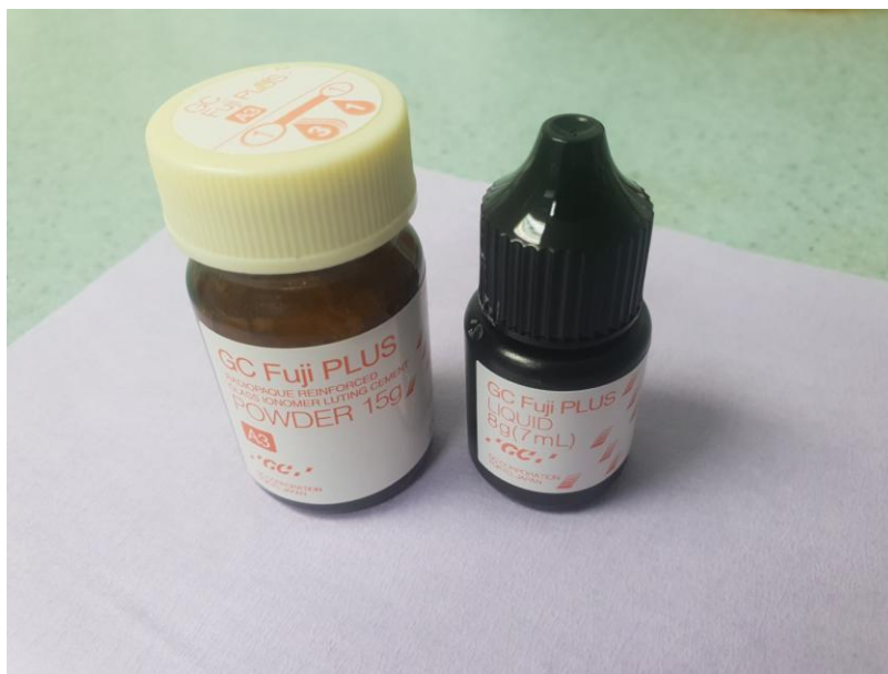
Slika 5. Staklenoionomerni trajni cement ( GC Fuji PLUS )

Pojavom bezmetalnih protetskih konstrukcija i visoko postavljenim estetskim standardima, u modernoj stomatologiji sve se više koriste kompozitni cementi. Njihova je prednost u odnosu na druge trajne cemente adhezija na tvrda zubna tkiva i nadomjestak, netopljivost u vlažnom mediju, krase ih izuzetna mehanička i estetska svojstva, boja i translucencija. Čine tzv. monoblok: zub (nadogradnja) – kompozitni cement – nadomjestak. Zbog izuzetnih mehaničkih svojstava, kompozitnim cementima cementirani nadomjesci podnose veće vrijednosti žvačne sile. Prema načinu polimerizacije, kompozitni cementi mogu biti kemijski i svjetlosno polimerizirajući, ovisno o kemijskom sastavu. Sve češće dolaze u dualnom obliku gdje su oba načina polimerizacije moguća. Sastoje se od umjetne smole, odnosno od metaakrilata i nekih drugih metaakrilatnih monomera, anorganskih punila, katalizatora, stabilizatora i pigmenata. U sastavu mogu biti i samojetkajuće komponente kao i aktivatori za kemijsko ili svjetlosno stvrdnjavanje ili oboje (82, 83).