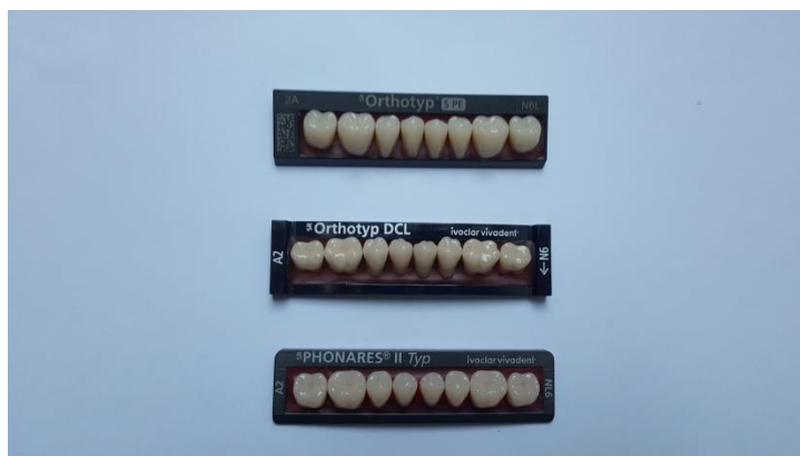
Slika 11. Prefabricirani zubi

Umjetni zubi svojim oblikom i bojom moraju odgovarati preostalim zubima u cilju postizanja funkcijske i estetske harmonije (Slika 11.). Oblik i veličina zuba moraju biti u skladu s oblikom lica i konstitucijom pacijenta. S obzirom na oblik razlikuju se četvrtasti, trokutasti i ovalni zubi, što se prvenstveno reflektira na odabiru prednjih zuba (41). Munsell analizira boju na temelju triju različitih dimenzija: nijanse, svjetline i kromatografske vrijednosti (42).