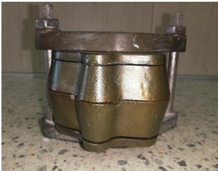
Slika 5. Kiveta

Još uvijek najčešći način izrade baze mobilnih proteza jest toplinska polimerizacija. Ona znači da se akrilatno tijesto nastalo miješanjem PMMA praha i MMA kapljevine stavlja u suvišku u dvodijelni kalup (kivetu) (Slika 5.) ili se ubrizgava pod pritiskom u posebne kivete, a pritisak ostaje do kraja polimerizacijskog postupka.