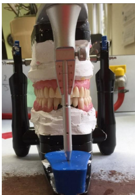
Slika 12. a. Postava zuba u artikulatoru – pogled sprijeda

Ako je riječ o protezi koja nadomješta malen broj zuba („žabica“) (Slika 11.), međučeljsni se odnosi i boja određuju pri uzimanju otiska ireverzibilnim hidrokoloidom. Kod izrade privremenih djelomičnih proteza gdje je okluzija zadovoljavajuća i jasno definirana, također se međučeljsni odnosi mogu odrediti pri uzimanju otiska. Ako se (zbog nedostaka zuba antagonista, primjerice) ne mogu zadovoljavajuće odrediti međučeljsni odnosi tijekom uzimanja otiska, potrebno je izraditi zagrizne šablone, a međučeljsne odnose odrediti poslije. Tada se određuje i boja zuba. Treba odrediti skladnu boju, koja odgovara pacijentu. Kod potpunih proteza međučeljsni registar uvijek se radi sa zagriznim šablonama. Pri određivanju međučeljsnih odnosa idealno je odrediti i registar obraznim lukom kako bi se radni modeli i njihov odnos prema referentnoj ravnini / referentnim ravninama prenijeli u artikulator (Slika 12. a i b).