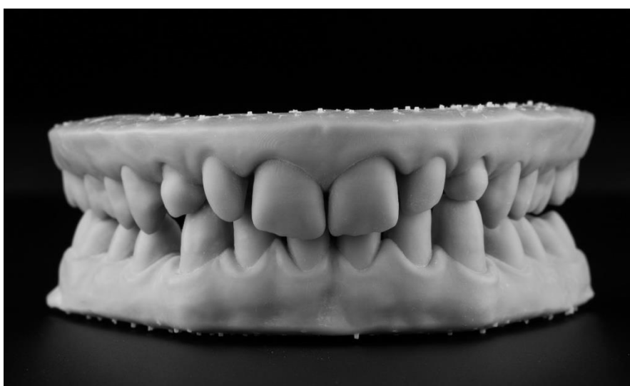
Slika 2. Digitalni 3D printani modeli gornje i donje čeljusti

ispisati u 3D pisačima ili izglođati iz diska ako stomatolog ili tehničar zatrebaju fizički model (Slika 2). Oni se izrađuju od polimera na bazi polimetilmetakrilata (PMMA). To se sve češće i radi jer je materijal jeftin, a preciznost i stabilnost modela je visoka (5) što omogućava korištenje modela kao anatomskih i radnih u analizama ili slojevanju ako se ne rade monolitni radovi.