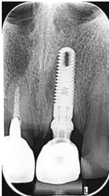
Slika 4. Kontrolna rendgenska snimka nakon zahvata s uredno postavljenim implantatom.