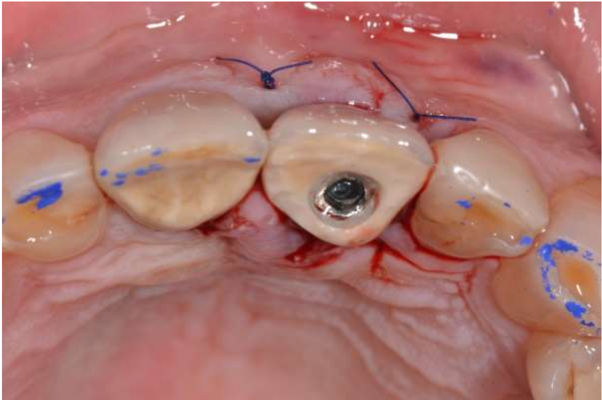
Slika 3. Rana zatvorena šavovima i provizorna krunica na implantatu učinjena od frakturirane krune zuba 21.