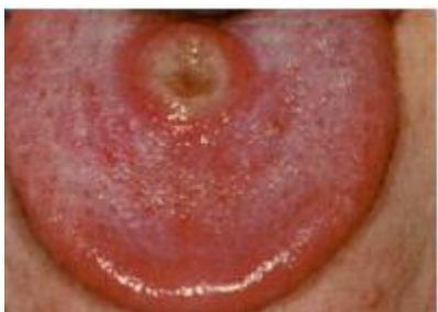
Slika 1. Ulcus durum na jeziku. Preuzeto iz (5).

Oko 50% bolesnika zaraženih sifilisom boluje i od neke druge spolno prenosive bolesti, od čega se u 25% radi o koinfekciji virusom humane imunodeficijencije (HIV-om). Takve istovremene infekcije znatno mijenjaju kliničku sliku sifilisa, kao i tijek i težinu bolesti (5).