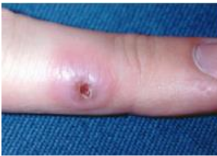
Slika 13. Herpetična zanoktica. Preuzeto iz (5).