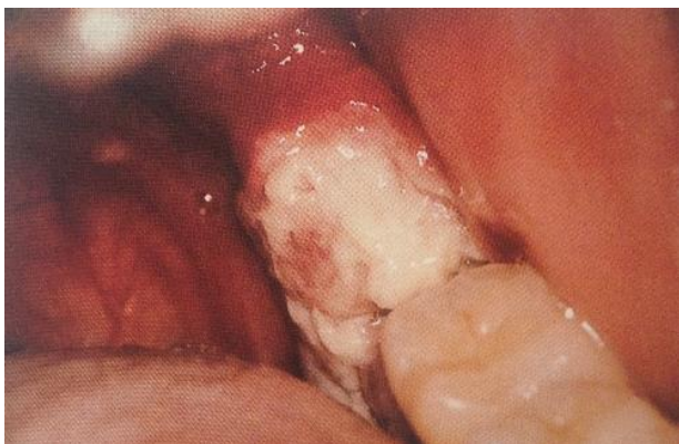
Slika 10. Non – Hodgkin limfom. Preuzeto iz (9).