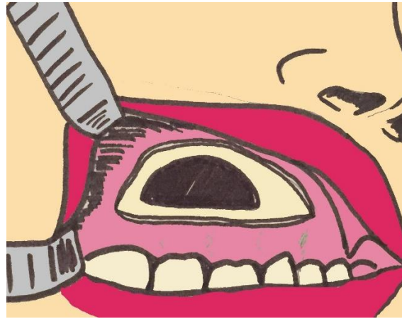
Slika 4. Caldwell-Luc - transoralni pristup maksilarnom sinusu

povećanje njenoga volumena kod bolesnika s Graves oftalmopatijom ili maksilarnoj arteriji kroz stražnju stijenku sinusa u slučaju jake epistakse. Transmaksilarni pristup omogućava resekcije živaca u slučaju neuralgije (ggl. sphenopalatinum i n. maxillaris) ili vazomotornog rinitisa (n. canalis pterygoidei) (19).