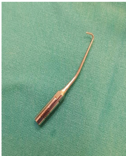
Slika 8. Piezoelektrični nastavak za preparaciju retrogradnog kaviteta