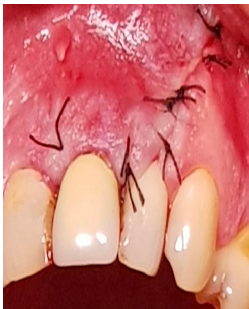
Slika 13. Stanje nakon šivanja