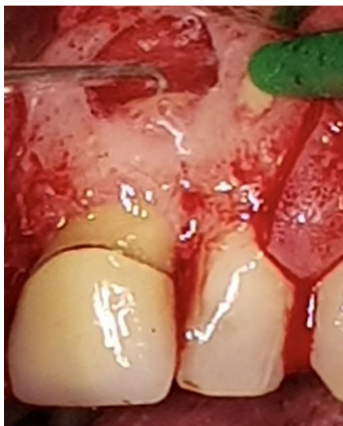
Slika 9. Preparacija retrogradnog kaviteta