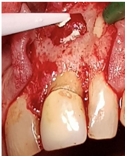
Slika 12. Aplikacija materijala za retrogradno punjenje