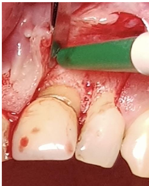
Slika 2. Trokutasti rez i odizanje režnja