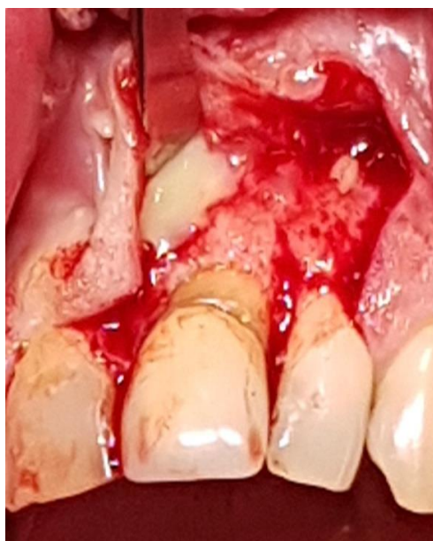
Slika 3. Purulentni sadržaj nakon trepanacije otvora na koštanoj stijenci