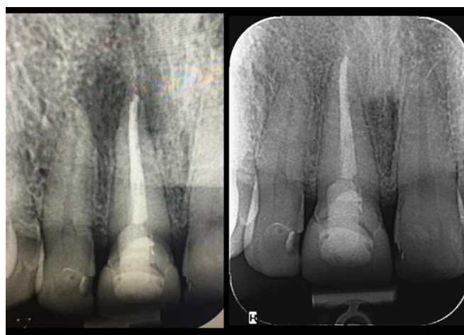
Slika 5. Rendgenski nalaz upalnog periapikalnog procesa zuba 11 (lijevo) i kontrolna rendgenska snimka nakon 10 mjeseci od endodontskog liječenja (desno) na kojoj je vidljivo kompletno cijeljenje upalnog periapikalnog procesa

Zacjeljivanje periapikalne lezije počinje u prvoj godini nakon zahvata (35), no za potpunu restituciju često je potrebno više godina (29). Udio potpuno zacijeljenih lezija varira od 75% (32) do 86% (36). Od svih zubi koji su s vremenom zacijelili, 50% do 70% zacijelilo je unutar prve godine (31), dok se postotak lezija koje su zacijelile između 2. i 4. godine diže na 90%. Nakon 6 godina, postotak se diže i na visokih 95% (29). Ostalih 5%, prema istraživanju Fristada i sur. (37), može cijeliti čak i u drugom i trećem desetljeću nakon tretmana. Navedena studija provedena je na zubima koji su endodontski revidirani 20-27 godina ranije te su kasne periapikalne promjene, s uspješnim ishodom, zabilježene kada je praćenje od 10 do 17 godina nakon tretmana korijenskog kanala produženo za dodatnih 10 godina. Perzistentne asimptomatske periapikalne radiolucencije, posebno one s prekomjernim punjenjem, općenito se ne bi trebale klasificirati kao neuspjeh jer će mnoge lezije zacijeliti nakon dužeg razdoblja promatranja (37).