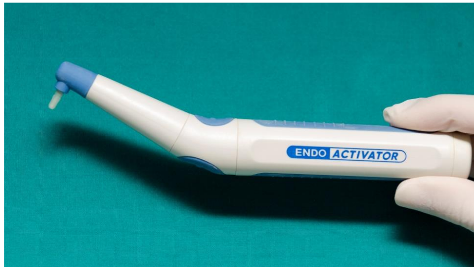
Slika 1. EndoAktivator (Dentply Sirona)