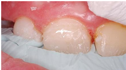
Slika 16. Caklinski sloj labijalno