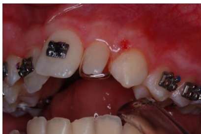
Slika 3. Proba celuloidne krunice