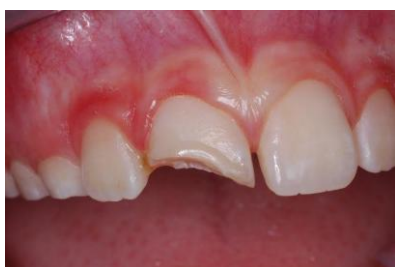
Slika 5. Frakturirani zub 11