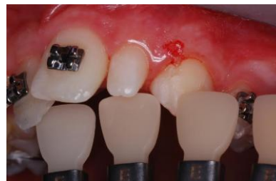
Slika 2. Odabir boje