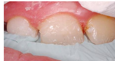
Slika 17. Translucentni materijal