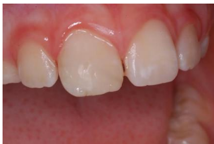
Slika 9. Završni izgled zalijepljenog fragmenta