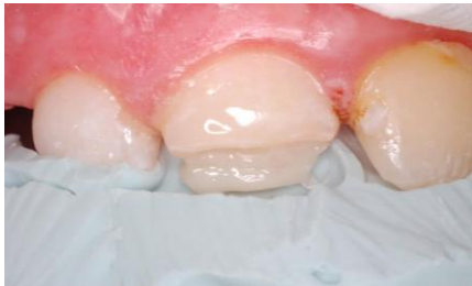
Slika 14. Caklinski sloj palatinalno