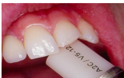
Slika19. Izbor boje Cerec keramičkog bloka

keramike debljine do 0.3 mm. Njihova prednost je očuvanje tvrdih zubnih tkiva, brza i jednostavna izrada te jednostavno uklanjanje. Nedostatak je vrlo zahtjevna laboratorijska izrada i visoka cijena (25).