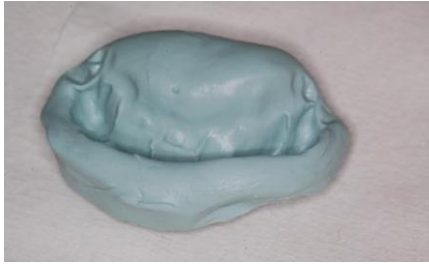
Slika 12. Silikonski otisak