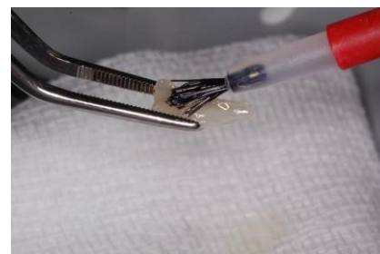
Slika 8. Lijepljenje fragmenta