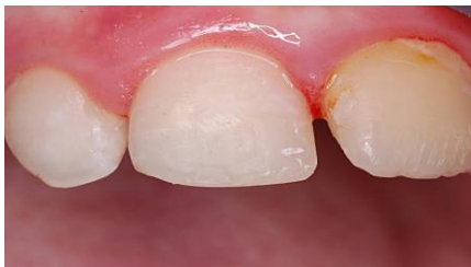
Slika 18. Konačan rezultat