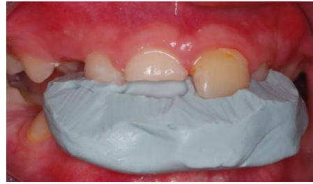
Slika 13. Silikonski ključ