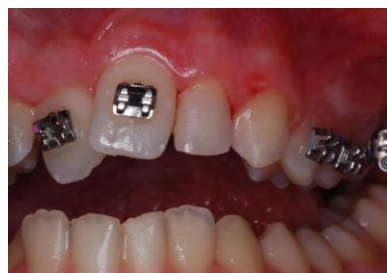
Slika 4. Nadogradnja zuba