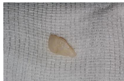
Slika 6. Frakturirani fragment