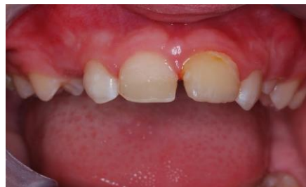
Slika 11. Modeliranje u vosku