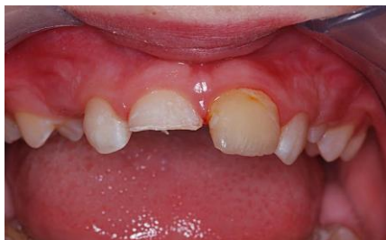
Slika 10. Truma zuba