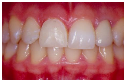
Slika22. Cementirana Cerec faseta u