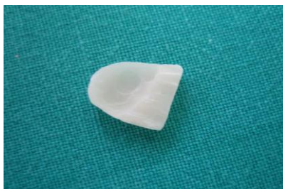
Slika21. Gotova Cerec faseta ustima