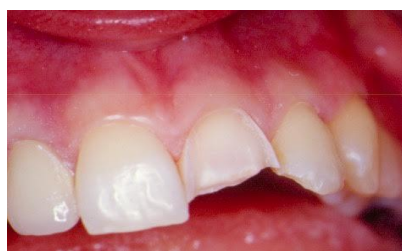
Slika20. Preparacija za fasetu