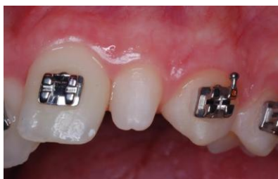
Slika 1. Mikrodoncija zuba