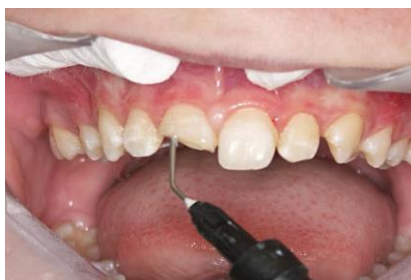
Slika 7. Nanošenje kompozita