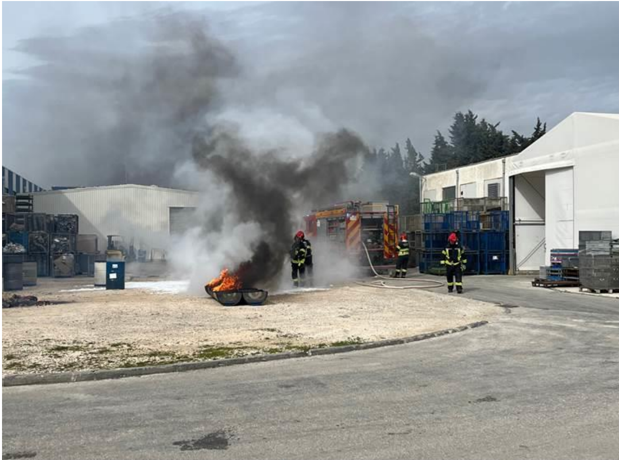
Slika 5. Vježba evakuacije, spašavanja te pokazna vježba za djelatnike [26]

Radnici trebaju dobiti formalnu obuku o postupcima u hitnim situacijama i procesima upravljanja požarom kao dio njihovog uvođenja u posao. Radnicima se treba redovito pružiti dodatna obuka o postupanju u hitnim situacijama. Po dolasku u zgradu, svi posjetitelji trebaju dobiti upute i informacije o sustavu upozorenja požarnim alarmom, evakuacijskim putovima i točkama okupljanja u slučaju požara [25].