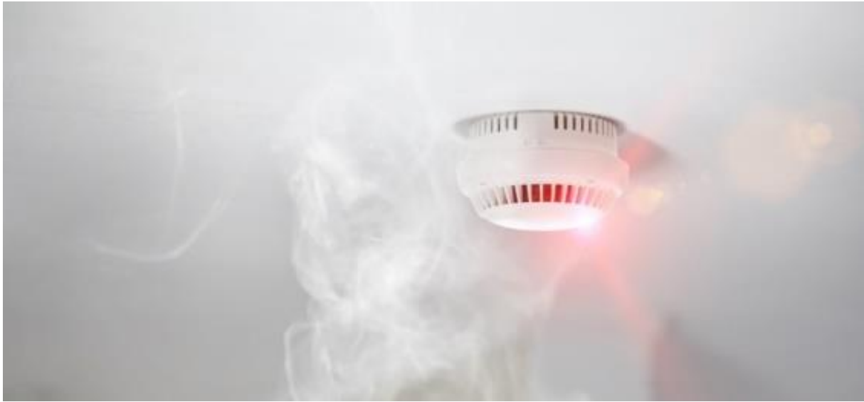
Slika 3. Tradicionalni detektor dima [15]

često prije nego što dim ili plamen postanu vidljivi. Neki moderni sustavi čak koriste umjetnu inteligenciju (AI) za analizu obrazaca i prepoznavanje potencijalnih opasnosti [14].