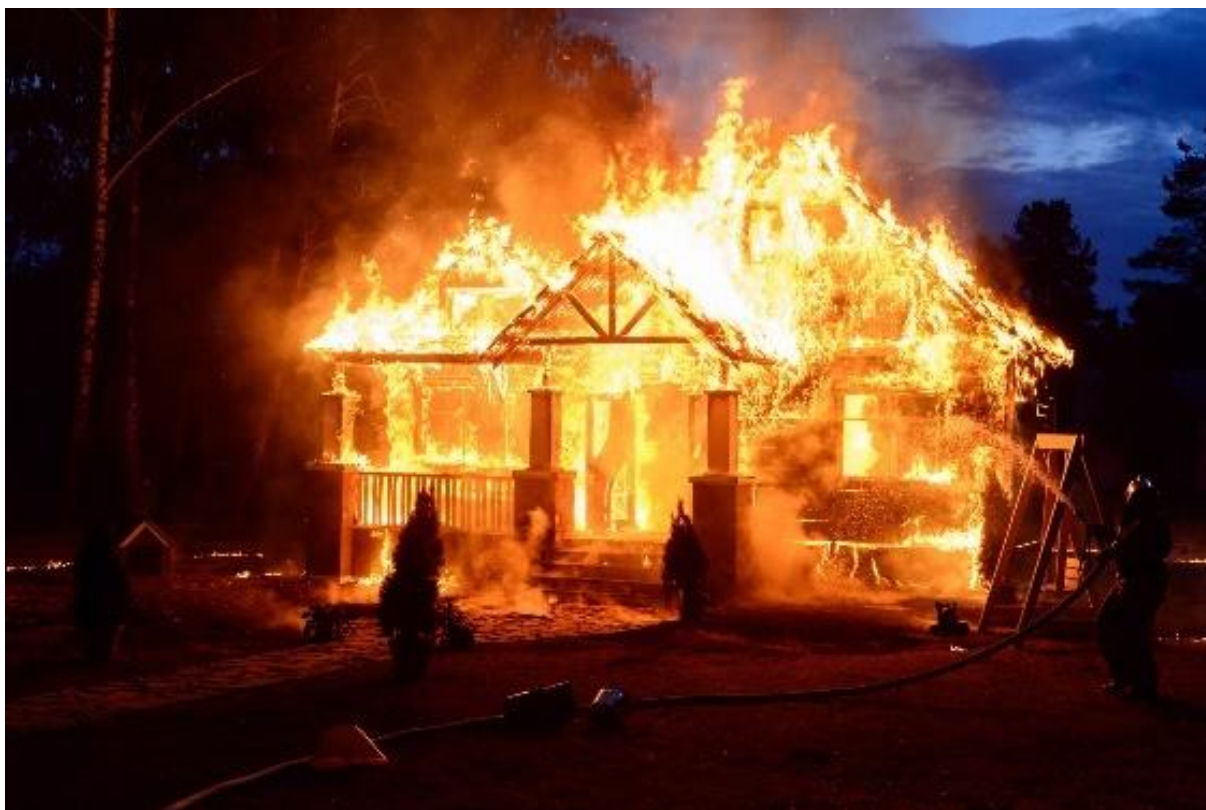
Slika 1. Požar [2]

Požar je proces samostalnog gorenja koji se pokreće namjerno kako bi se proizvelo korisne učinke, kontrolirano u vremenu i prostoru (Slika 1.). Gorenje je izloženost procesu izgaranja gdje se tvar rasplamsava uz oslobađanje topline, često uz plamen i/ili žar i/ili dim. Gorenje je fizičko-kemijski proces koji se sastoji od tri važna elementa: kemijske promjene tvari, oslobađanja topline i oslobađanja svjetlosti. Kako bi vatra nastavila gorjeti, potrebno je gorivo, zrak (kisik u udjelu od 15 do 17%) i temperatura paljenja. Tvari se razlikuju prema svojim svojstvima poput izgleda, boje, topljivosti, okusa, prozirnosti i tvrdoće. S vatrogasnog stajališta, tvari se dijele na gorive (koje mogu gorjeti pod određenim uvjetima) i negorive (koje se neće zapaliti u normalnim uvjetima) [1].