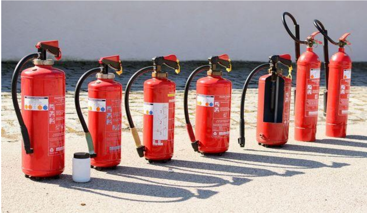
Slika 6. Aparati za gašenje požara [41]

Nakon pojave požara, temperature požara mogu doseći i do 1.000°C, a rezultirajuća toplinska ekspanzija i degradacija svojstava materijala predstavljaju ozbiljnu prijetnju konstrukcijskog sigurnosti građevine. Tijekom ove faze požara, glavni cilj aktivnih sustava zaštite od požara je spriječiti širenje požara uz osiguranje stabilnosti konstrukcije. Da bi to postigli, važno je da svi konstruktivni i nekonstruktivni elementi zadovoljavaju kriterije požarne sigurnosti. Ovi pasivni sustavi zaštite od požara omogućuju sigurne operacije gašenja požara, sigurne operacije evakuacije i smanjuju gubitke imovine [40].