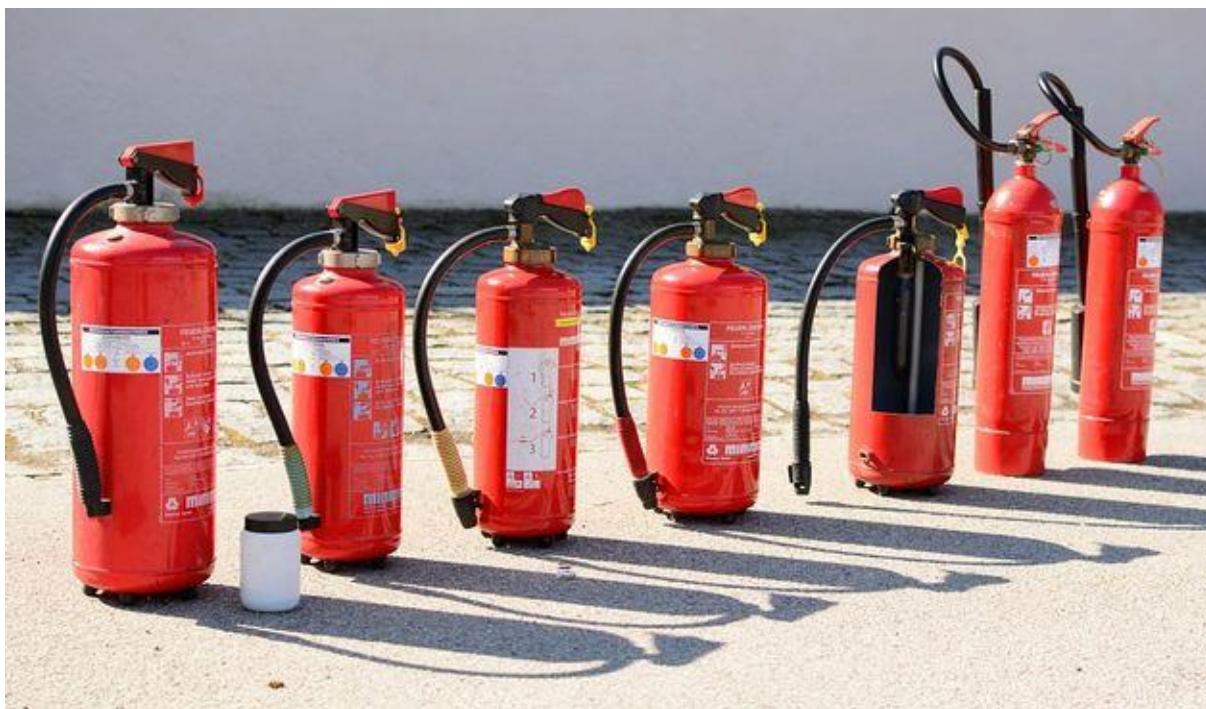
Slika 6. Aparati za gašenje požara [41]

Nakon pojave požara, temperature požara mogu doseći i do 1.000°C, a rezultirajuća toplinska ekspanzija i degradacija svojstava materijala predstavljaju ozbiljnu prijetnju konstrukcijskog sigurnosti građevine. Tijekom ove faze požara, glavni cilj aktivnih sustava zaštite od požara je spriječiti širenje požara uz osiguranje stabilnosti konstrukcije. Da bi to postigli, važno je da svi konstruktivni i nekonstruktivni elementi zadovoljavaju kriterije požarne sigurnosti. Ovi pasivni sustavi zaštite od požara omogućuju sigurne operacije gašenja požara, sigurne operacije evakuacije i smanjuju gubitke imovine [40].