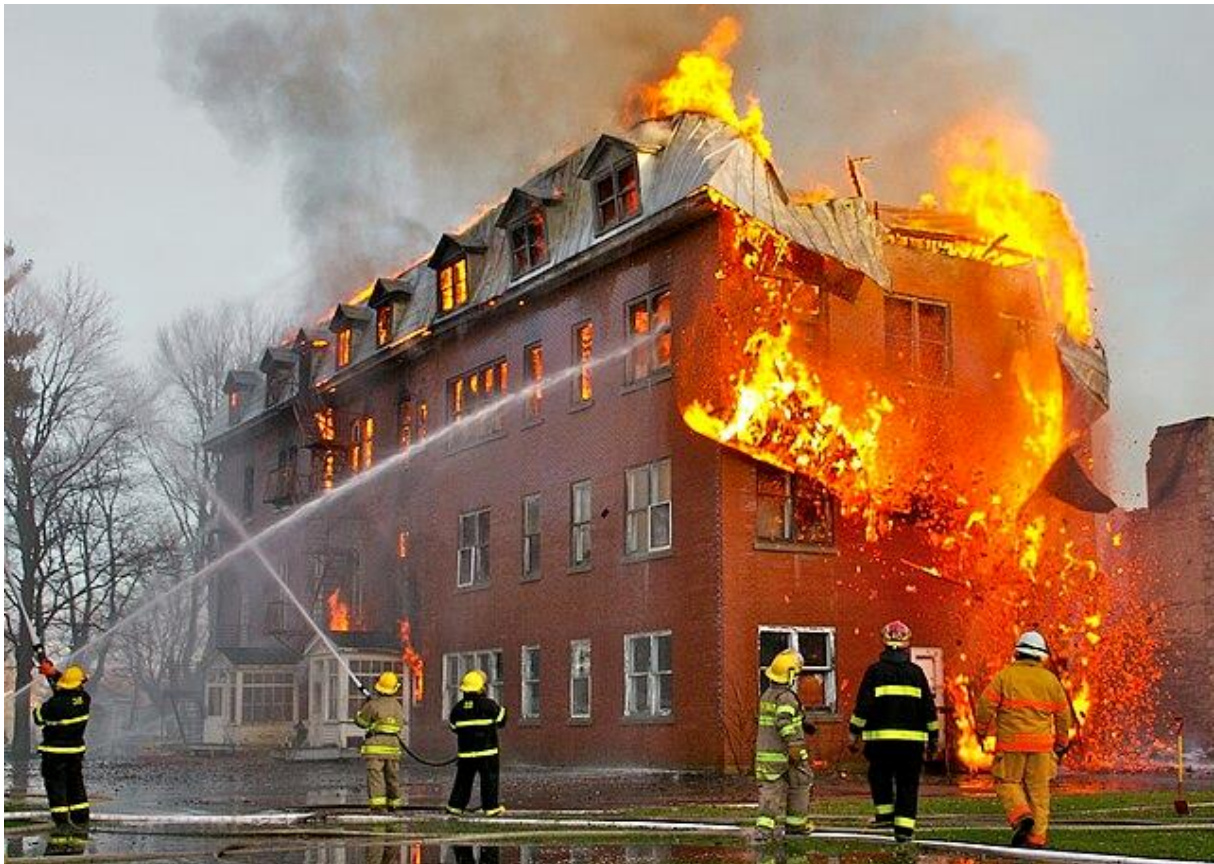
Slika 2. Požar zgrade [7]

posljedične gubitke kao što su gubitak proizvodnje, nezaposlenost i smanjenje izvoza, iako na nacionalnoj razini ti gubici ne doprinose značajno ukupnom gubitku od požara [6].