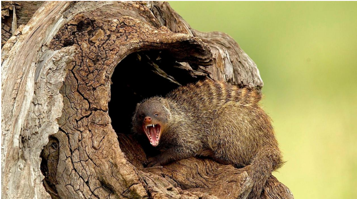
Slika 8. Nakostriješeni mungos

Glavni način obrane mungosa je prikrivanje i skrivanje. Boja njihove dlake stapa se s okolišem te su tako manje izloženi opasnosti. No, kada dođe do situacije kada se mora suočiti s određenim neprijateljem, mungos ima isti obrambeni stav kao i mačke. Leđa im se izvinu, podignu repove i nakostriješe dlaku te ih to čini duplo većim od njihove normalne veličine. Kako bi otjerali protivnika proizvode razne zvukove kao što su režanje i lavež, a ako im se neprijatelj previše približi, mungosi napadaju jakim ugrizima. Uz to, za vrijeme borbe, iz analnih žlijezda izlučuju sekret koji miriši kao mošus.