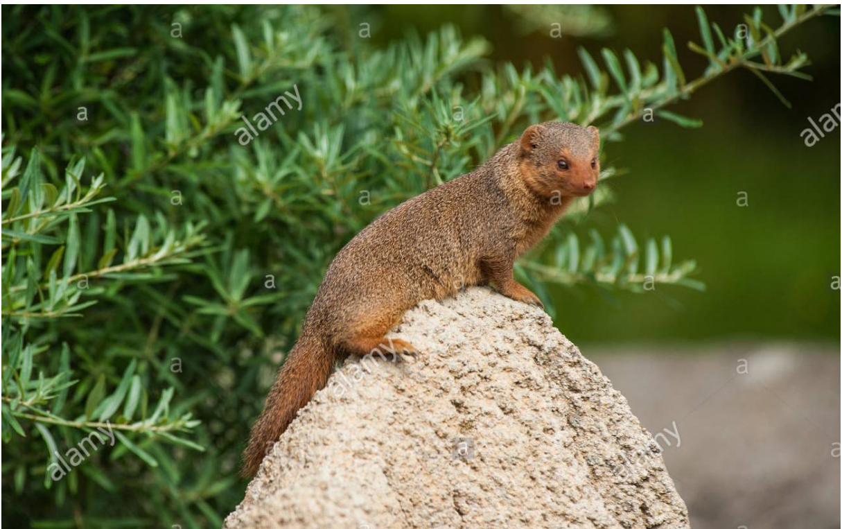
Slika 6. Mungos u izvdnici

Mungosi u skupini komuniciraju trljanjem dlanova, ispuštanjem glasova ili hrvanjem. Na popodnevним vrućinama cijela skupina mungosa se sunča na leđima oko svog brloga.