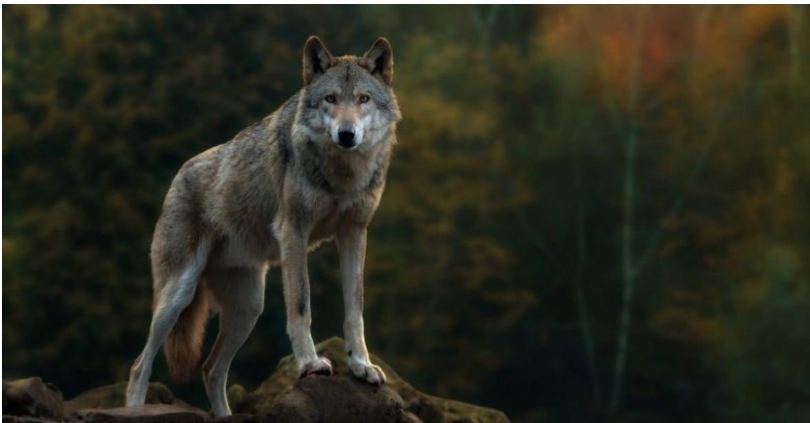
Slika 1 Sivi vuk ( Canis lupus L. )

Veličina tijela i boja dlake su različite te variraju s obzirom na stanišne uvjete i prilike, stoga se u literaturi spominje više podvrsta sivog vuka. Osim sivog vuka, poznate su još dvije živuće vrste vukova, to su crveni vuk ( C. rufus ) i abesenski vuk ( C. simensis ).