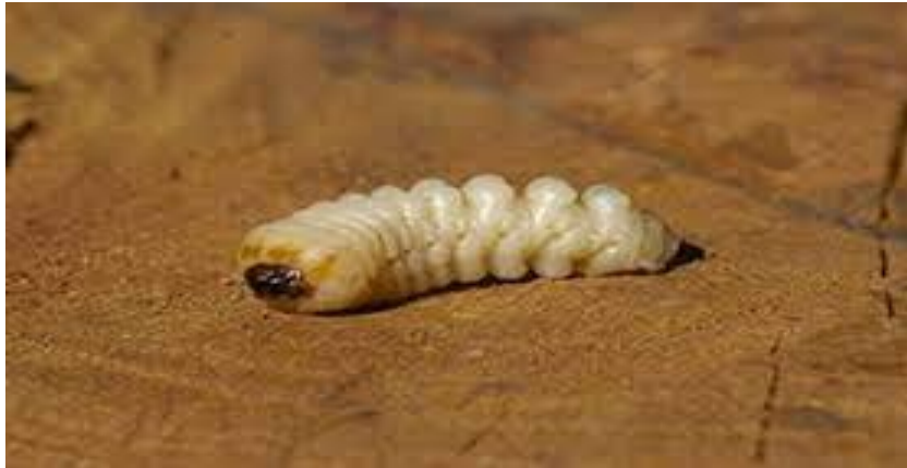
Slika 19. Na fotografiji je prikazan Xylotrechus chinensis u stadiju ličinke na drvu.