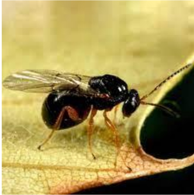
Slika 7. Kestenova osa šiškarića ( Dryocosmus kuriphilus ) u odraslom stadiju na listu pitomog kestena ( Castanea sativa )