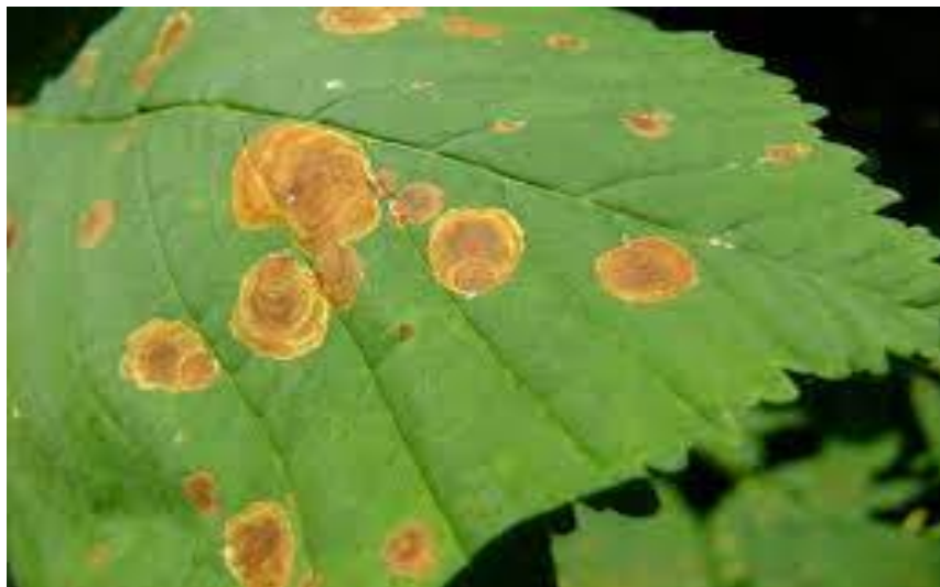
Slika 5. Mine kestenovog moljca minera ( Cameraria ohridella ) na listu divljeg kestena ( Aesculus hippocastanum )

Najznačajniji štetnik stabala divljeg kestena ( Aesculus hippocastanum L.) je kestenov moljac miner. Iz tog zaključujemo da je isključivo vezan za urbane šume i parkove jer divlji kesten ne nalazimo na prirodnim šumskim staništima u Hrvatskoj. Ličinke stvaraju mine na gornjoj strani listova divljeg kestena. Mine su diskolorirana mjesta na listu na kojima je parenhimsko staničje pojedeno. Na taj način kestenov moljac miner smanjuje asimilacijsku površinu lista divljeg kestena.