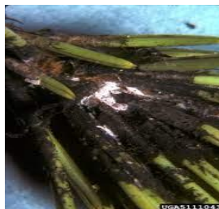
Slika 17. Na fotografiji je prikazan C.pini prilikom napada koji uzrokuje nekrozu iglice bora

C.pini napada samo vrste porodice Pinaceae . Zabilježen je na P. nigra Arnold, P. parviflora „Glauca“, P. radiata D. Don, P. pinea i P. halepensis Miller. Hrani se i razvija na borovim iglicama. Upravo na njima i pravi najveću štetu. Napadnute iglice postaju žute i nekrotiziraju. Ovaj štetnik razvija specifičnu sluz zbog koje iglice napadne plijesan. Krošnje nakon napada obilježi djelomično do potpuno odumiranje.