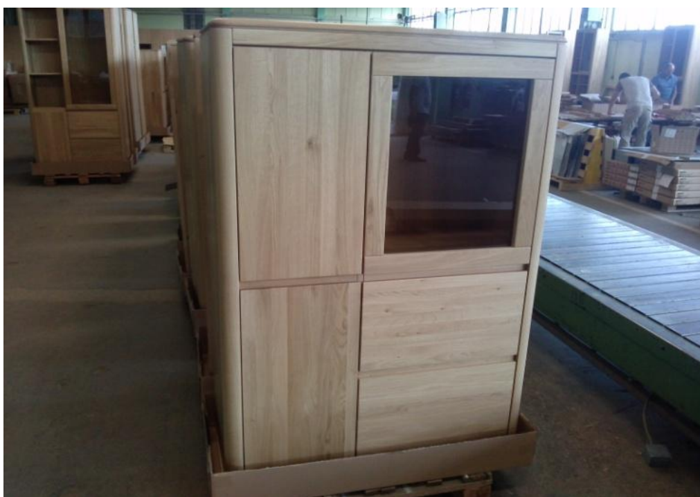
Slika 20. Proizvod 3 - vitrina od hrastovine površinski obrađena uljima