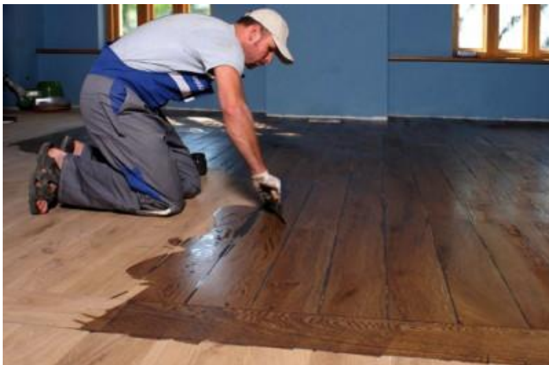
Slika 5. Nanošenje ulja lopaticom