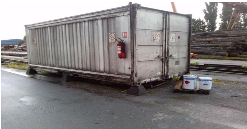
Slika 9. Spremište ulja i lakova

Ulja skladište u posebnom zatamnjenom kontejneru koji štiti od utjecaja atmosferilija. Temperatura tog prostora mora biti od +5 °C do +25 °C.