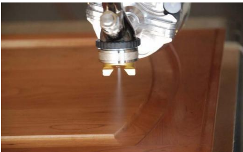
Slika 6. Nanošenje ulja HVLP štrcanjem

Pri štrcanju se koriste pištolji s niskim tlakom (HVLP) koji imaju grubo raspršivanje, ne stvaraju maglu i zbog toga su dobri za nanošenje ulja. Nanošenje štrcanjem ima svoje prednosti kao što su jednakomjerno nanošenje po površini, manje dodatnog rada, dobro iskorištavanje materijala i kratko vrijeme obrade.