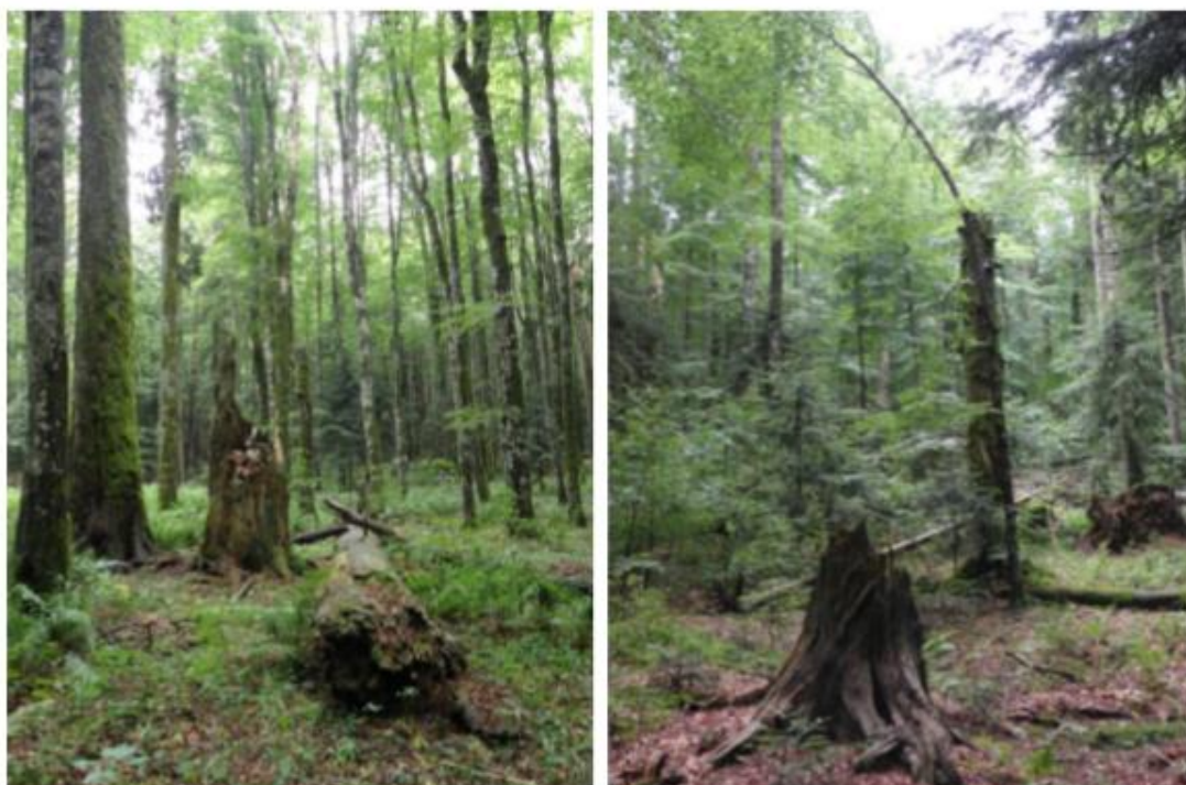
Slika 2. Ploha 1 u Klepinoj dulibi.

mlada stabla jele i smreke. Normalna unimodalna distribucija nije karakteristična za prašumske ekosustave i vjerojatno je rezultat značajnijeg antropogenog utjecaja prije više od 50 godina. Na plohi 2 distribucija broja stabala oblikom je bliža prašumskoj distribuciji usporedno onoj na plohi 1. Distribucija ima padajući oblik porastom debljinskog razreda s ponovnim povećanjem broja debelih stabala (80 cm promjera). Na cijeloj površini prašume pronalazimo progale sklopa nastale djelovanjem vjetra, kao i odumiranjem starih stabala. U progalama se pojavljuju pomladak jele i bukve koji polagano urasta u nadstojne slojeve sastojine. U drugom dijelu prašume vidljiva je progaljnost sklopa na većoj površini (> 1000 m 2 ), što je uvelike rezultat vjetroizvala.