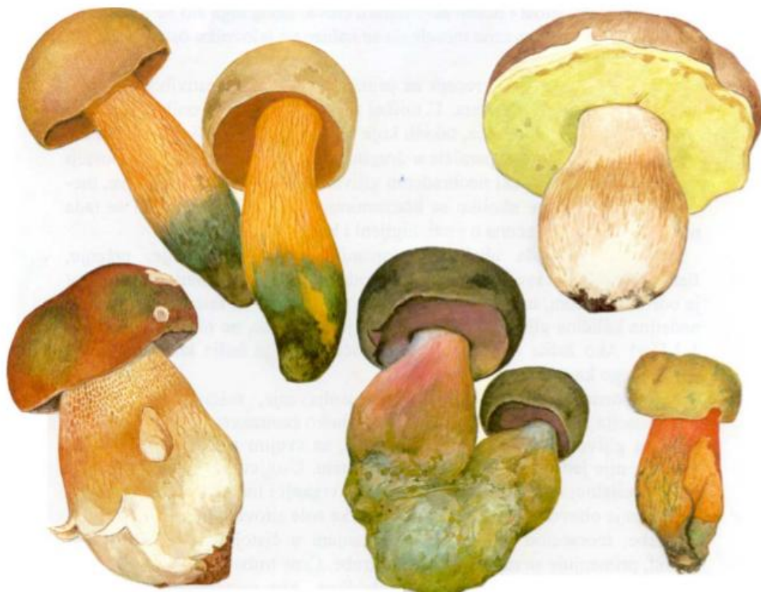
Slika 3. Rod Boletus – pravi vrganji (preuzeto iz Uzelac, 2005)

Pravi vrganji (Slika 3.) su rod gljiva unutar porodice Boletaceae . Pretpostavlja se da danas postoji više od 100 vrsta unutar ovog roda. Opisao ih je Carl Linnaeus 1753. godine. To su krupne gljive koje imaju robusnu dršku (Medved, 2015). Imaju trbušast stručak koji je izuzetno mesnat, pun i sa istaknutom mrežicom te je postavljen centralno u odnosu na klobuk bez vjenčića (Širić i sur., 2012). Neke vrste mogu promijeniti boju mesa na zraku ili na dodir, ali to nije znak otrovnosti gljiva nego je jedna od karakteristika koje pomažu pri determinaciji jedinke (Božac, 2003). Raste u svim šumama i gotovo sve vrste žive u simbiozi (Božac, 1963). Vrste unutar ovog roda formiraju s biljkom ektomikorizu (Božac, 2008).