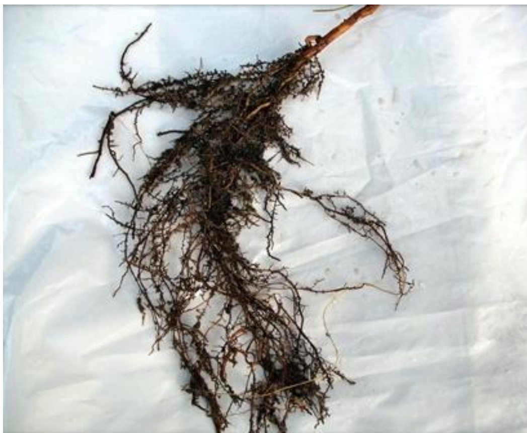
Slika 1. Uzorak korijenja sa mikozirom

Simbiotska zajednica koja se stvara između gljive i korijena stablašice se zove mikoriza (Slika 1.) (grč. mykos =gljiva + rhiza =korijen), a javlja se kod svih golosjemenjača i kod 82% dosad istraženih vrsta kritosjemenjača (Fiziologija šumskog drveća, 2013). Mikorizu je otkrio poljski botaničar Franciszek Kamienski 1880. godine (Čolić, 2013). Micelij gljiva obavija korijenje biljke te uz pomoć tankih i brojnih hifa funkcionalno zamjenjuje korjenove dlačice. Na taj način gljive snabdijevaju biljku mineralnim tvarima, potiču korijenje na rast i grananje te štite biljku od patogenih gljiva i bakterija u tlu, a od biljaka uzimaju ugljikohidrate.