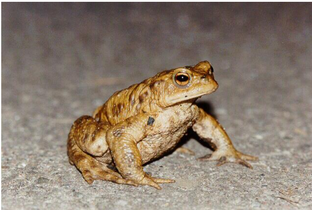
Slika 7. Sme a krasta a

Krasta e posjeduju zdepasto tijelo i tvrdu bradavi astu koflu. Nemaju zuba, a ni pliva e koflice. Ve inom borave na kopnu, slabo ska u pa su im prednje i straflnje noge gotovo jednake duljine. Najpoznatija krasta a je sme a krasta a (slika 7.) i ona je jedno od najrasprostranjenijih vodozemaca Europe, a nalazi se i u Aziji i na sjeverozapadu Afrike. fivot uglavnom provodi na kopnu, a nastanjuje listopadne -ume i -umarke, otvorena stani-ta (npr. livade) pa ak i urbana podru ja. Velika je 8-20 cm i njave a je flaba Hrvatske, tako er ima bradavice ili bodlje na kofli i velike bakrene ili zlatne o i. fienke su obi no puno ve e od mufljaka, posebice tijekom sezone parenja tj. prolje a jer im tada tijelo sadrfli jaja. Za vrijeme razmnoflavanja mufljacima se razvijaju pal ani fluljevi kojima se slufle kako bi vr- e prihvatili flenku. Okupljaju se u barama, a flenke omotavaju vrpce s jajima oko podvodnog bilja. Hrani se kukcima, pufljevima i ostalim manjim flivotinjama. Uglavnom je no na flivotinja, dok se po danu skriva ispod su-enog drve a i u drugim vlafnim mjestima. Iza o iju joj se nalaze parotidne flijeзде koje izli uju nadrafluju e tvari pomo u kojih odbijaju grabefljljivce, a kad uo i opasnost guta zrak, napuhuje se i propinje na prste da izgleda ve e. Unato svemu rijetko grize i nije prijatnja za ovjeka.