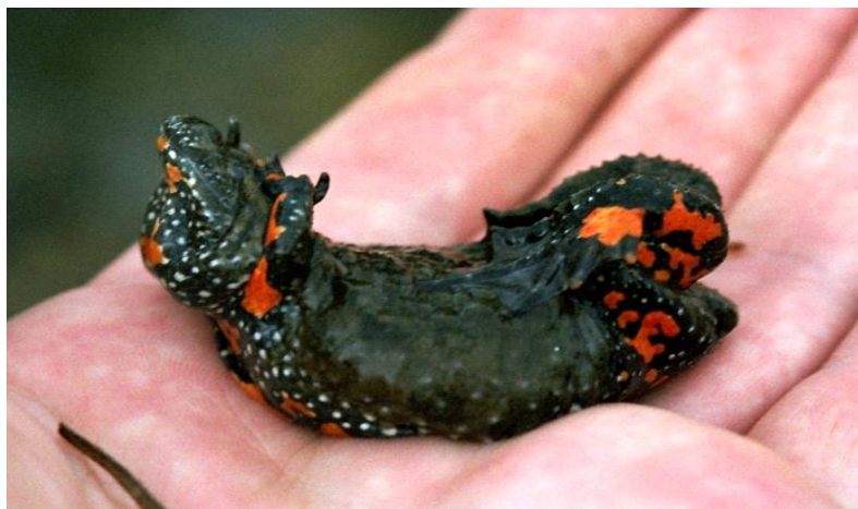
Slika 5. Svjetlocrvene mrlje donje strane crvenog muka a

Muka i su karakteristi ni po okruglastom plo astom jeziku koji ne mogu izbaciti iz usta, vrlo su vezani uz vodu i rijetko izlaze iz mlaka. U staja im vodama Nizinske Hrvatske nalazi se crveni muka ija je le na strana tamnomaslinaste boje dok mu se na trbu–noj strani prelijevaju svjetlocrvene mrlje (slika 5.). Male je veli ine i dostifle otprilike 4,5 cm. Odrasle jedinke su aktivne od po etka travnja do sredine lipnja. Razmnoflavanje se obi no odvija od kraja travnja ili sredine svibnja do sredine lipnja. Punoglavci obitavaju u vodi od kraja travnja do sredine kolovoza. Rasprostranjen je po srednjoj i isto noj Europi, te od Azije do Urala. U Hrvatskoj isklju ivo nastanjuje prostor Panonske nizine, a u podru jima kontaktnih zona (npr. Turopolja i rubova slavonskog gorja) stvara hibridne zone sa flutim muka em koje se rasprostiru na kilometre. fiuti muka nastanjuje male lokve brdovitih podru ja. Odozgo je tamnozelene boje poput blata, a odozdo flut sa crnim pjegama.