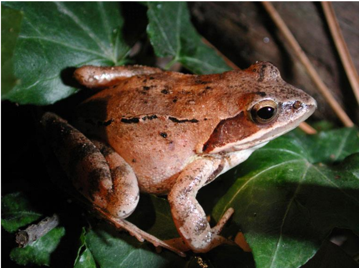
Slika 10. Tamnosmeđe pjege na leđima smeđe flabe

fiabe ( Ranidae ) imaju zube samo u gornjoj eljusti. Šumska smeđa flaba je mala flaba oko 5-9 cm vrlo dugih stražnjih nogu pomoću kojih može izvesti skokove i do nekoliko metara. Svjetlosmeđe je boje sa smećim prugama na stražnjim nogama i tamnosmećim pjegama na leđima ima oblika slova "V" (slika 10.). Mufljaci se razlikuju od ženki po tanjim prednjim udovima. Većinom je kopnena vrsta, nastanjuje otvorene šumske predjele i vlažne livade. Rasprostranjena je diljem sjeverne, srednje i južne Europe. Zimi i u toplim razdobljima sakriva se ispod osušenih stabala i kamenja ili se zakopava ispod vegetacije, a mufljaci često znaju prezimiti ispod zelenih bara i jezera. Razmnožavanje se odvija u proljeće i kada se led počinje topiti, a jaja polažu u vodu u obliku grudastih nakupina (slika 11.).