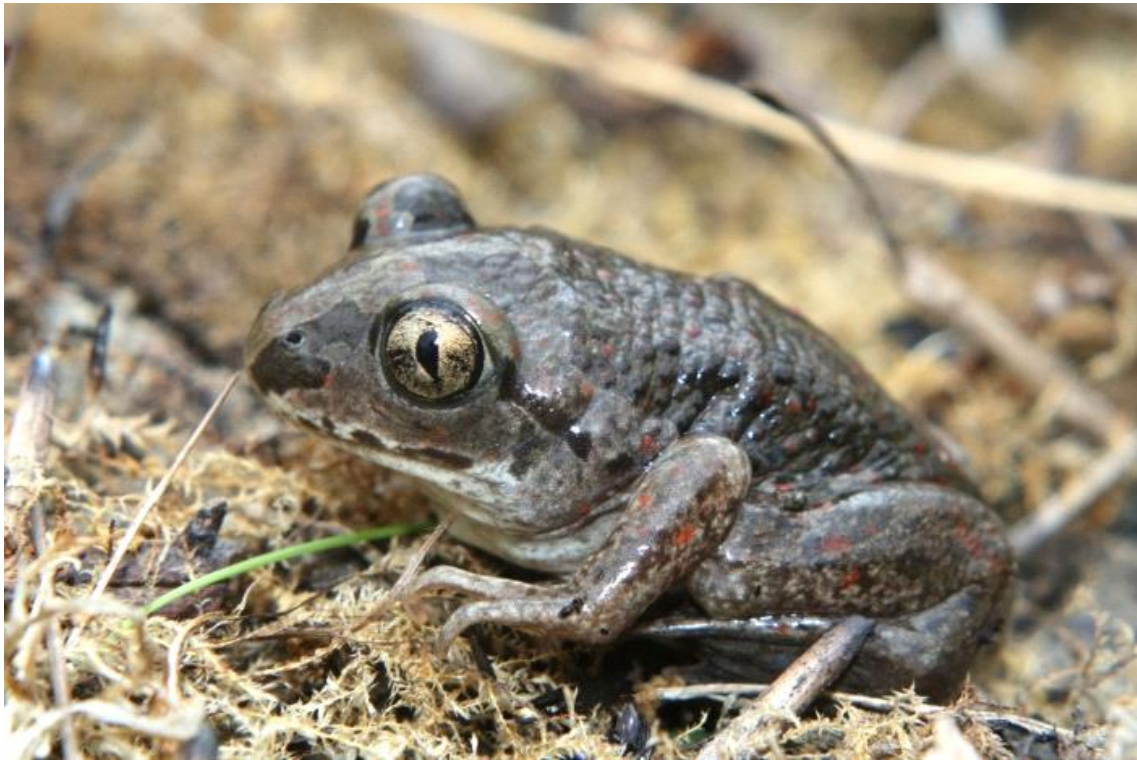
Slika 6. Obična češnjača

Obična češnjača (slika 6.) je velika 4-8 cm i posjeduje sive lopataste tvorevine na stražnjim udovima uz pomoć kojih se natrag ukopava u tlo. Obitava na kopnu, a staništa joj su travnjaci, livade, ledine i obradive površine. Nalazi se u srednjoj i istočnoj Europi, te na zapadu Azije. Pri uznemirenju joj kožne flijezde porizvode izlučenu koja mirisom podsjeća na češnjak, te služi za odvratanje grabljivaca. Osim toga tokom opasnosti može i udahom zrakadi i tijelo na sve 4 noge kako bi dala iluziju veće veličine. Hrani se kukcima i ostalim manjim beskraljevcima. Razmnožava se tokom proljeća, a njeni punoglavci su najveći punoglavci Hrvatske i mogu doseći čak 12 cm.