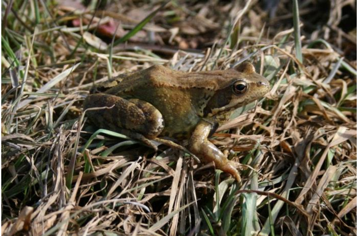
Slika 12. Isprugani stražnji udovi livadne smeđe flabe