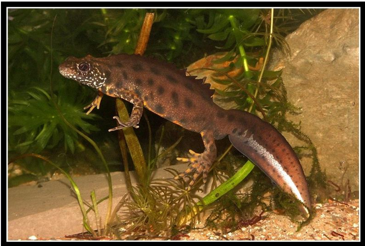
Slika 4. Mufljak sa nazubljenom krijestom i bijelom prugom na repu

Veliki vodenjak (poznat i po nazivu %hrapavi vodenjak%) je duga ak oko 10-14 cm, gornja strana tijela mu je tamnosme e boje i karakteristi ne hrapave teksture, dok mu je donja strana naran asto obojena sa crnim -arama ili pjegama. Ve i dio svoga flivota provede na kopnu, ali na 3-5 mjeseca godi-nje provede u barama, jezerima ili kanalima. Rasprostranjen je diljem Europe i u sredi-njem dijelu Azije. Razmnoflava se tijekom prolje a i ljeta, tokom ega mufljaci dobijaju nazubljenu krijestu na le ima dok mu se na repu pojavljuje bijela ili plava pruga (slika 4.). Mufljak se udvara flenki podvodnim plesom nakon kojeg joj prenosi spermatofore. fienke polafu jaja pojedina no te ih omotavaju li- em radi za-tite. Iako je -iroko rasprostranjen po Europi broj mu se smanjuje zbog isu-ivanja stani-ta koja su nufna tokom parenja.