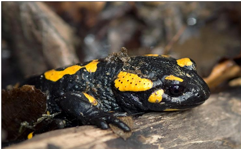
Slika 3. Vidljive otrovne žlijezde iza oči

Šareni daždevnjak je veličine 18-28 cm i upe atljivih boja koje služe kao upozorenje grabljivcima da je otrovan. Boja mu ovisi o geografskom položaju, pa može biti crna s crnim mrljama i prugama ili crno-crna, a crna boja može biti zamijenjena narančastom ili crvenom bojom. Iza oči mu se nalaze otrovne žlijezde (slika 3.) koje proizvode izlučevine koje izazivaju neugodnost pri konzumaciji. Potpuno je kopnen, te obitava u listopadnim šumama i umjerskim predjelima gorskih područja. Rasprostranjen je po Africi, Europi i na zapadu Azije. Zimu provodi pod zemljom, a najaktivniji je noću, osobito nakon kiše, te tada izlazi iz rupa ispod sušenih stabala ili kamenja. Hrani se gujavicama, pučavcima, kukcima i njihovim ličinkama. Razmnožava se u proljeće i ljeto, nakon velikih kiša. Tokom parenja mužjak sa gornje strane snažno drži ženku i ispušta spermatofoore, nakon toga se lagano odbaci sa strane kako bi omogućio ženki da ih pokupi. Jaja se razvijaju u unutrašnjosti ženke do stadija ličinke, pa može doći i do pojave kanibalizma u jajovodu kada ličinke koje se brzo razvijaju počinju jesti druge manje ličinke i jaja. Ženka izbacuje mlade u bare ili potoke. Kod nekih populacija u višim predjelima mladi se u ženkinom tijelu razvijaju čak do odraslog stadija.