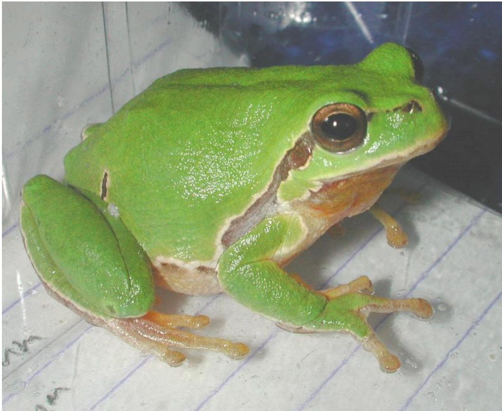
Slika 9. Upadljiva uzdužna tamna pruga gatalinke

Gatalinke (porodica) se zadržavaju u krošnjama drveća, grmlja, travi itd. pa posjeduju okrugle jastuče na vrhovima prstiju pomoću kojih se kreću po uspravnim i glatkim površinama. Gatalinka (vrsta) je mala žaba velika samo 3-5 cm. Sjajnozeleno je boje, a može biti i plava ili smeđa, te ima upadljivu tamnu uzdužnu prugu po glavi i tijelu (slika 9.). Posjeduje prijanjaljke koje joj pomažu pri penjanju. Ovo je široko rasprostranjena vrsta koja se nalazi na području skoro cijele Europe (osim jugozapada) i na zapadu Azije. U Hrvatskoj obitava gotovo svuda, osim u gorskim područjima i nekim mediteranskim krškim planinama (npr. Velebit i Biokovo). Uglavnom je kopnena, te živi u močvarama, makiji, umskim proplancima, umarcima, te na gusto obraslim rubovima blizu stajaćih voda. Nalazi se i u listopadnim i u mješanim umama, a najčešće u galerijskim umama vrba i topola blizu vodotoka. Tijekom zime hibernira. Razmnožava se u proljeće i ljeto, tada mufljaci proizvode glasan zvuk poput gakanja i stvaraju bučne zborove. Odrasle jedinke se zadržavaju u vodi od kraja travnja do sredine lipnja.