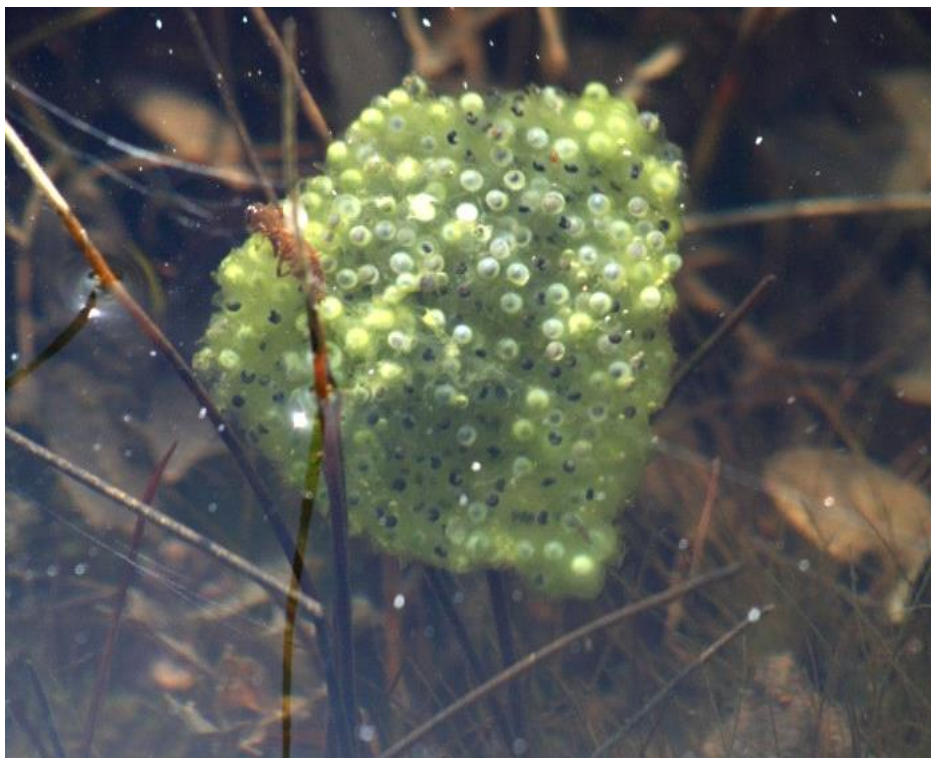
Slika 11. Grudasta nakupina jaja