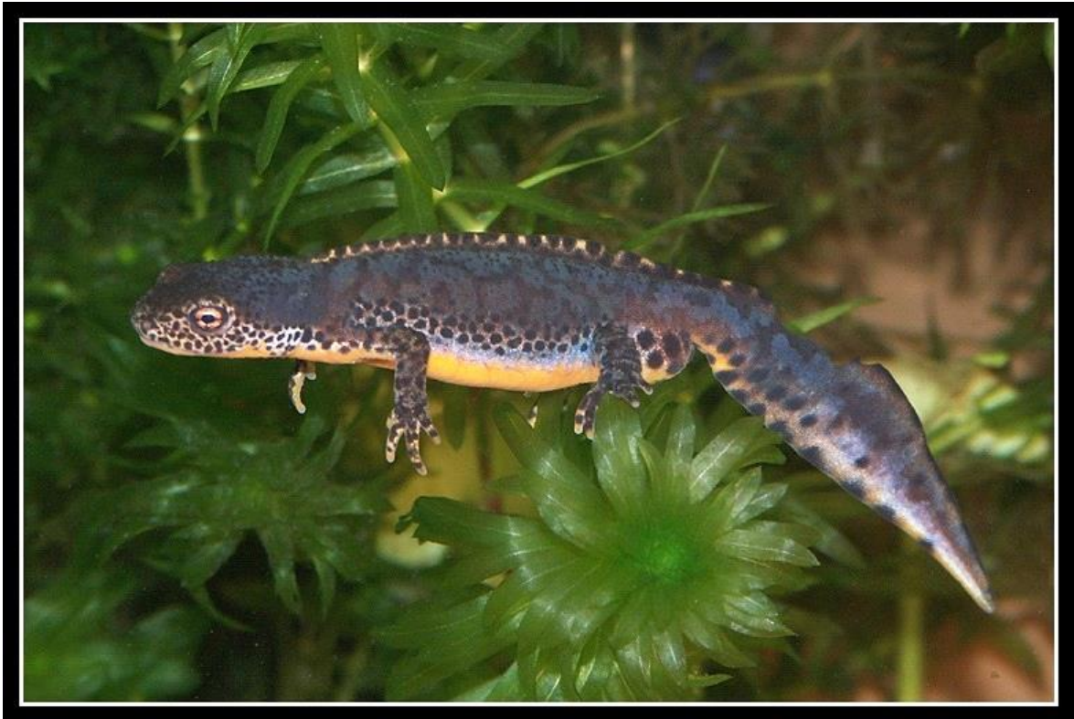
Slika 2. Karakteristične crno-bijele mrlje i krijesta mufljaka

Planinski vodenjak ima malo tijelo dugo 6-12 cm koje je sa gornje strane plave boje, a s donje naranaste i kratak rep. Većinu života obitava na kopnu, a nastanjuje planine i brda, te stajaće vode i močvare Europe. Tijekom parenja, u proljeće, mufljacima se pojavljuje crno-bijela krijesta, crno-bijele mrlje duž bokova (slika 2.) i povećavaju im se neisnicama. Koriste i se lepezastim pokretima repa mufljak se udvara ženki tako da izdvoji svoje feromone prema njezinoj njušci. Na Balkanu se nekad dogodi da planinski vodenjak cijav svoj životni ciklus provede pod vodom te zadržava značajke ličinke u odrasloj dobi (npr. vanjske krage).