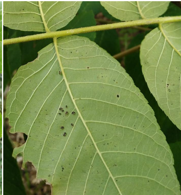
Slika 32. Ličinke i ekskrementi na naličju lista sivoga oraha ( J. cinerea )