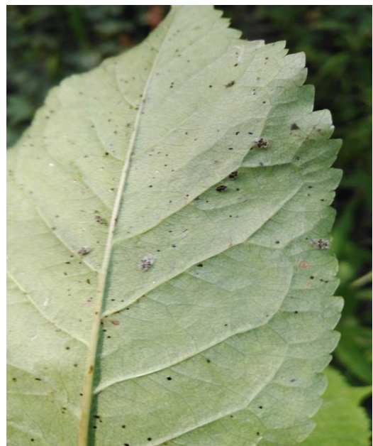
Slika 28. Imago, ličinke i ekskrementi na naličju lista divlje trešnje ( P. avium )