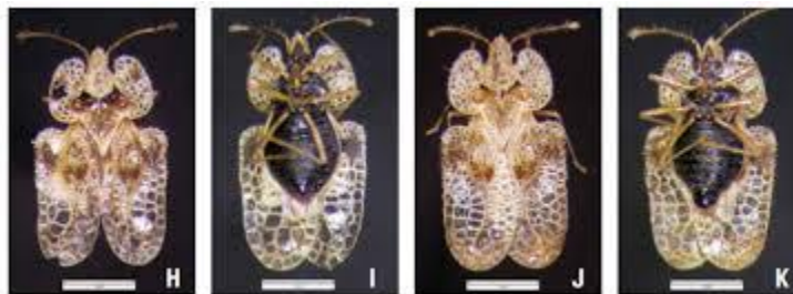
Slika 1. H i I- Ženka hrastove mrežaste stjenice ( Corythucha arcuata ) leđno i trbušno

Tingidae su porodica vrlo malih insekata, veličine od 2 do 10 mm iz reda Hemiptera, poznate kao mrežaste stjenice. Ova skupina je rasprostranjena širom svijeta, s oko 2000 opisanih vrsta. Nazivaju se mrežastim stjenicama zato što dorzalni dio prsišta i krila odraslih jedinki imaju nježnu i zamršenu mrežu. Njihovo je tijelo spljošteno dorziventralno, a mogu biti i potpuno ovalni i tanki. Glava je često skrivena ispod prsišta nalik na kapuljaču. Mrežaste stjenice mogu biti vrlo destruktivne za biljku. Većina ih se hrani na donjoj strani lišća sisajući biljni sok, a lišće tada poprima brončanu ili srebrnkastu boju. Svaka jedinka obično dovršava svoj životni ciklus na istoj biljci, uglavnom i na istom dijelu biljke. Veći dio vrsta ima jednu do dvije generacije godišnje, ali neke vrste imaju i više generacija. Većina njih prezimi kao odrasle jedinke, a neke kao jaja ili ličinke. Ova skupina ima nepotpunu metamorfozu, u nezreloj fazi slične odraslim jedinkama, razlika je u tome što su male i nemaju krila. Krilni jastučići se pojavljuju u drugom i trećem stupnju razvoja i rastu kako ličinka sazrijeva. Ovisno o vrsti, mrežaste stjenice imaju četiri do pet razvojnih stadija. Mrežaste stjenice ponekad slete i na ljude i grizu što uzrokuje neugodu, ali ne zahtjeva medicinsko liječenje.