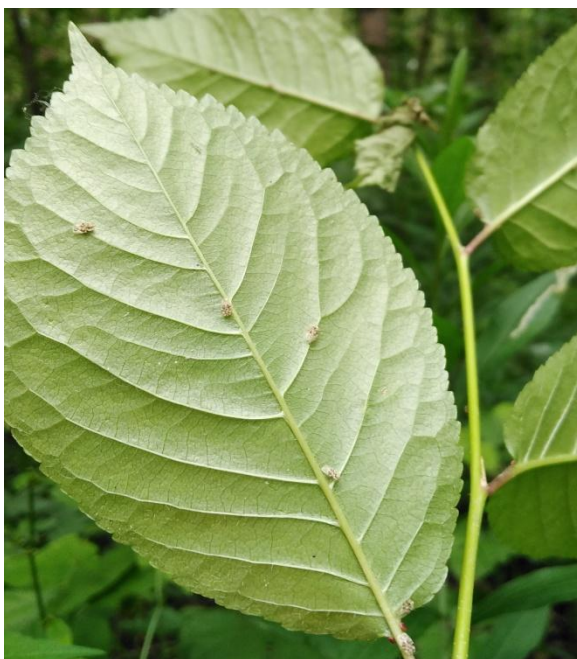
Slika 12. Imago stjenice na naličju lista divlje trešnje ( P. avium )