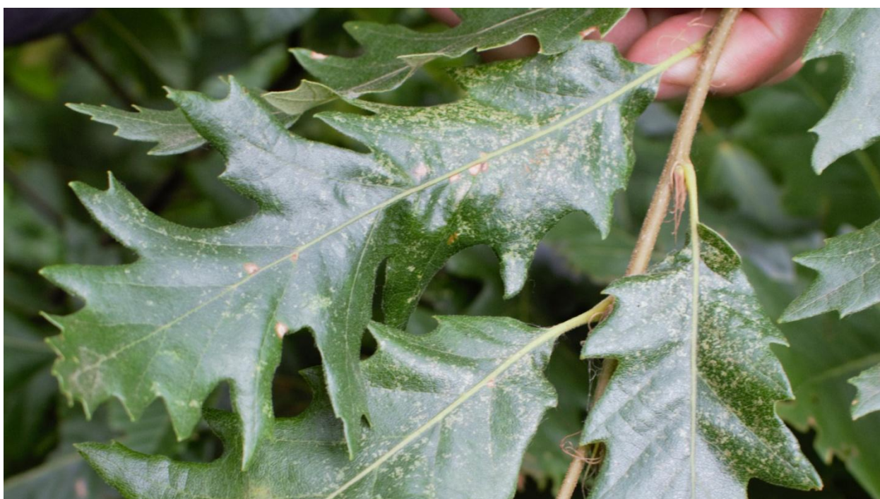
Slika 24. Kloroza na licu lista hrasta cera ( Q. cerris )