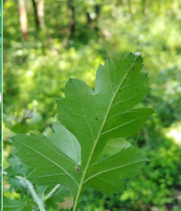
Slika 14. Imago i ekskrementi na naličju lista bijeloga gloga ( C. monogyna )