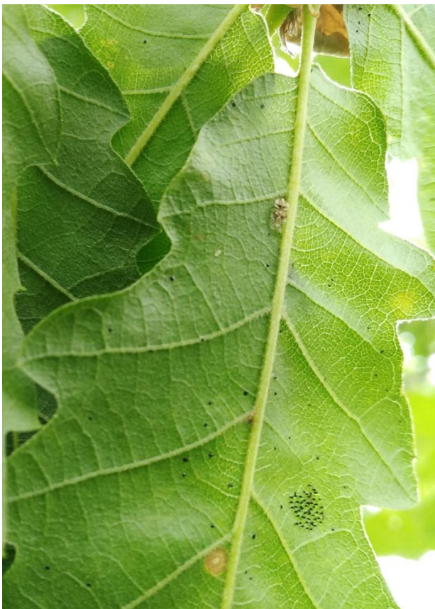
Slika 7. Imago, jajašca i ekskrementi na naličju lista hrasta cera ( Q. cerris )

Nakon pronalaženja hrastove mrežaste stjenice na različitim vrstama domaćina, fotografiranja i utvrđivanja točnih lokacija na kojima se nalazi, rezultati su prikazani tablično te su popraćeni fotografijama koje prikazuju razvoj stjenice kroz njezin razvojni ciklus i štete koje pričinjava tijekom istog.