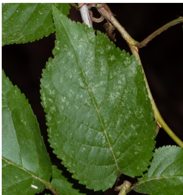
Slika 21. Kloroza na licu lista divlje trešnje ( P. avium )