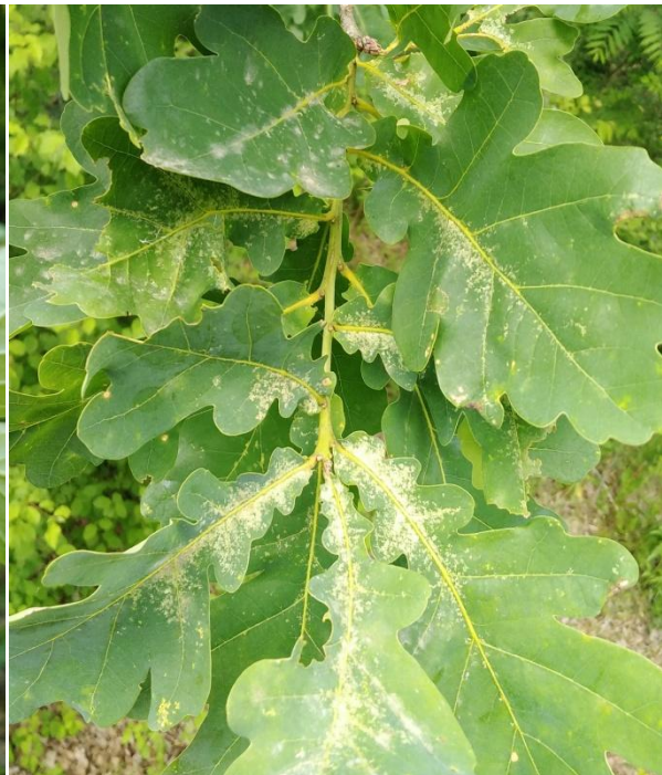
Slika 16. Kloroza lista hrasta lužnjaka ( Q. robur )