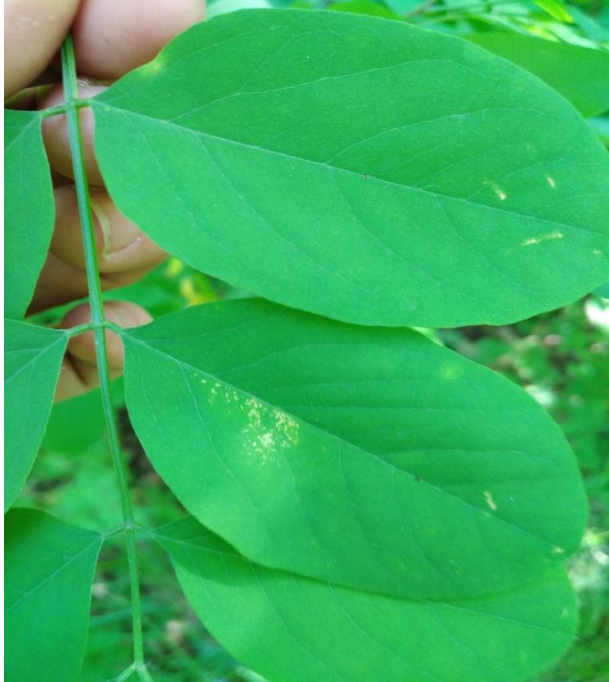
Slika 13. Vidljiva kloroza na licu lista običnoga bagrema ( R. pseudoacacia )