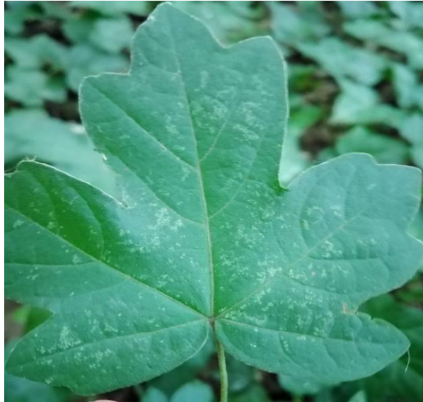
Slika 30. Kloroza na licu lista poljskoga javora ( A. campestre )