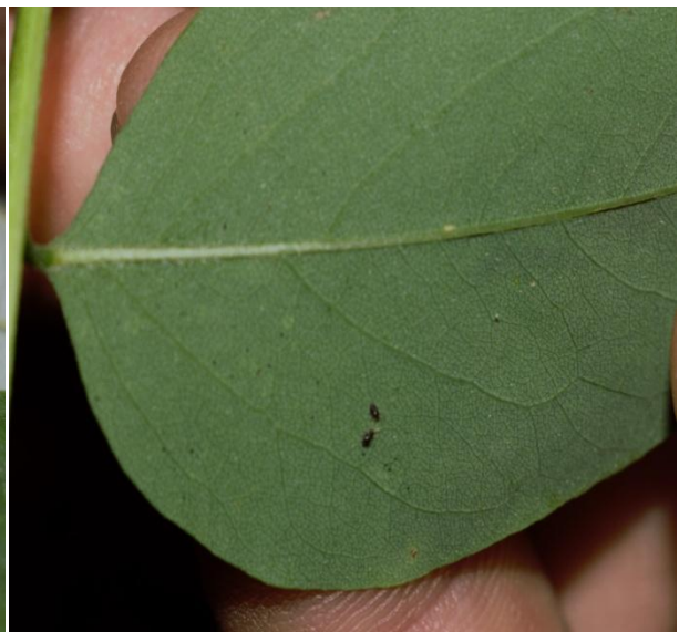
Slika 20. Ličinke i ekskrementi na naličju lista običnoga bagrema ( R. pseudoacacia )