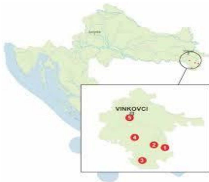
Slika 4. Prostorni raspored lokacija na kojima je po prvi put potvrđena prisutnost hrastove mrežaste stjenice

Na području istočne Slavonije 2013. godine potvrđena je prisutnost druge novounešene invazivne mrežaste stjenice za područje Hrvatske, hrastova mrežasta stjenica ( Corythucha arcuata /Say,1832/). Na pet ravnomjerno raspoređenih lokacija na području spačvanskih šuma, utvrđena je dobro zastupljena populacija ove stjenice u svim razvojnim stadijima (jaje, ličinka, imago) (Hrašovec i dr, 2013). Na području Hrvatske, od sedamdesetih godina prošloga stoljeća ovaj je rod zastupljen s jednom vrstom, plataninom mrežastom stjenicom ( Corythucha ciliata /Say, 1832/) (Maceljki i Balarin 1972). Vrsta je na europsko tlo unešena na području Italije gdje je i otkrivena u okolini Padove 1964. godine (Maceljki, 1986). Do unosa druge vrste ovoga roda proteklo je više od 30 godina.