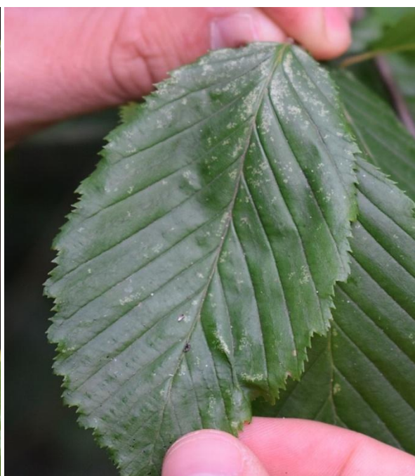
Slika 22. Kloroza na licu lista običnoga graba ( C. betulus )