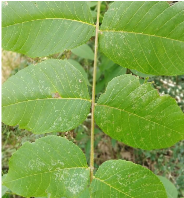
Slika 31. Kloroza na licu lista sivoga oraha ( J. cinerea )