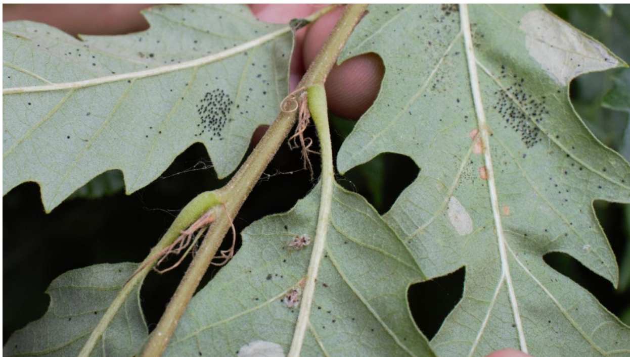
Slika 23. Imago, jajašca i ekskrementi stjenice na naličju lista hrasta cera ( Q. cerris )