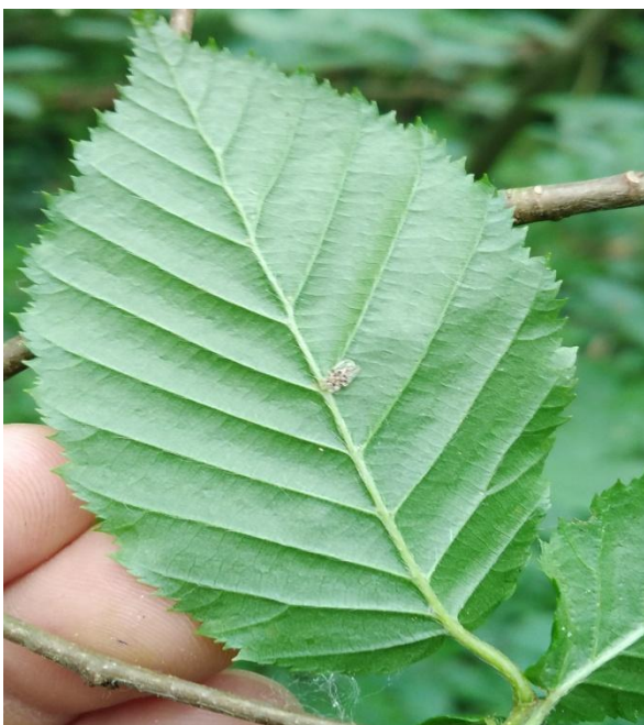
Slika 11. Imago stjenice na naličju lista običnoga graba ( C. betulus )