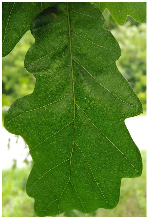
Slika 8. Jedva vidljiva kloroza na licu lista hrasta cera ( Q. cerris )