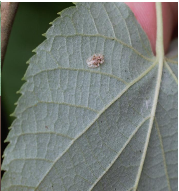
Slika 18. Imago i ekskrementi stjenice na naličju lista srebrnolisne lipe ( T. tomentosa )