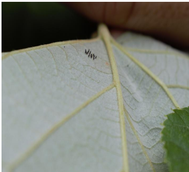
Slika 19. Jajašca stjenice na naličju lista srebrnolisne lipe ( T. tomentosa )