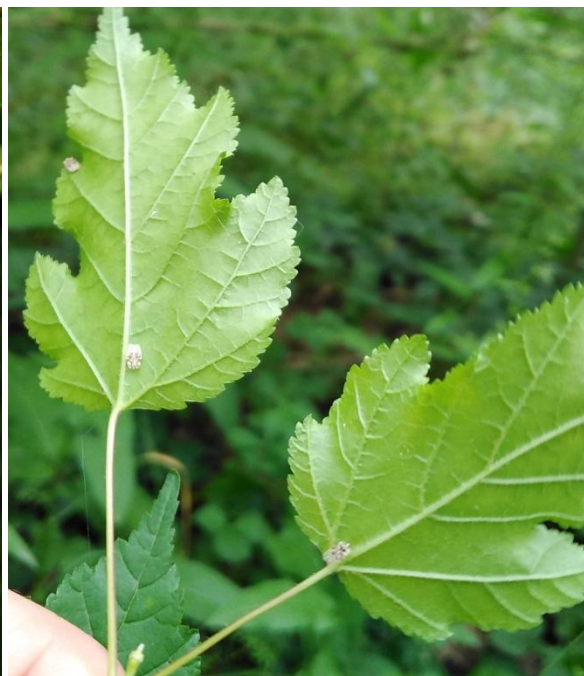
Slika 10. Imago stjenice na naličju lista žestilja ( A. tataricum )