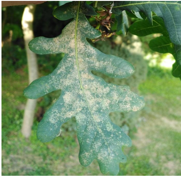
Slika 25. Kloroza na licu lista hrasta lužnjaka ( Q. robur )