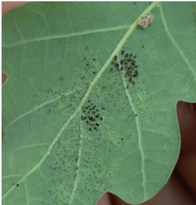
Slika 17. Imago, ličinke, jajašca i ekskrementi stjenice na naličju lista hrasta lužnjaka ( Q. robur )