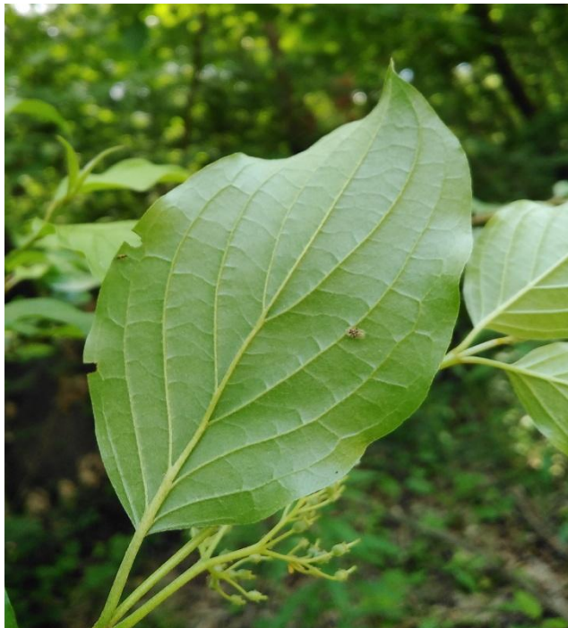
Slika 15. Imago stjenice na naličju lista sviba ( C. sanguinea )