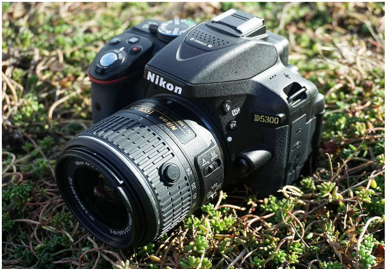
Slika 6. Fotoaparat koji je korišten za fotografiranje hrastove mrežaste stjenice

Terensko sakupljanje podataka obavljeno je u tri navrata: početkom lipnja, sredinom lipnja i sredinom srpnja. Za prikupljanje podataka bili su potrebni fotoaparati visoke rezolucije koji imaju mogućnost fotografiranja što više detalja na licu i naličju lista, u ovom slučaju Nikon D5300 sa 24.2 MP i HD kamerom te mobilna GPS aplikacija sa mogućnostima oznake mjesta, odnosno utvrđivanja lokacija na kojima je pronađena mrežasta hrastova stjenica.