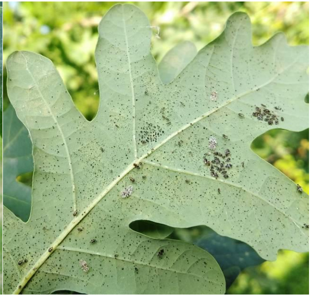
Slika 26. Imago, ličinke, jajašca i ekskrementi stjenice na naličju lista hrasta lužnjaka ( Q. robur )