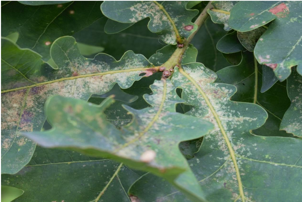
Slika 2. Šteta na hrastu lužnjaku ( Quercus robur L.) pričinjena sisanjem sokova hrastove mrežaste stjenice na naličju lista

Sjevernoamerički rod Corythucha (Heteroptera: Tingidae) obuhvaća 49 vrsta mrežastih stjenica autohtonih za područje Sjeverne Amerike (Froeschner i Miller 2002, Mutun i dr. 2009). Na području istočne Hrvatske od 2013. godine zabilježena je nova invazivna vrsta hrastova mrežasta stjenica ( Corythucha arcuata Say.). Hrastova mrežasta stjenica autohtona je na području Sjeverne Amerike. U prirodnom dijelu svoga areala hrani se sisanjem na listu različitih vrsta sjevernoameričkih hrastova i ne uzrokuje velike štete. Na području Hrvatske najveće štete primijećene su na hrastu lužnjaku ( Quercus robur L.). Također je zamijećena i na drugim vrstama: nizinskom brijestu ( Ulmus minor Mill.), običnom grabu ( Carpinus betulus L.), divljoj jabuci ( Malus sylvestris (L.) Mill.) i u manjoj mjeri na kupini ( Rubus spp.). Sisanjem biljnih sokova na listu uzrokuje sušenje i prerano otpadanje lišća.