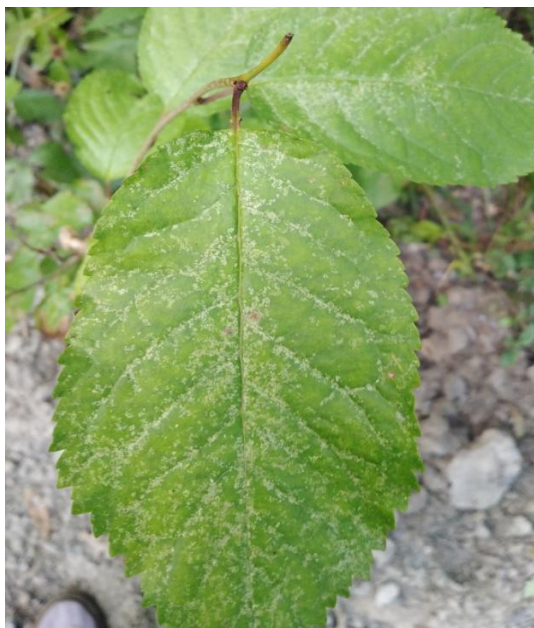
Slika 27. Kloroza na licu lista divlje trešnje ( P. avium )