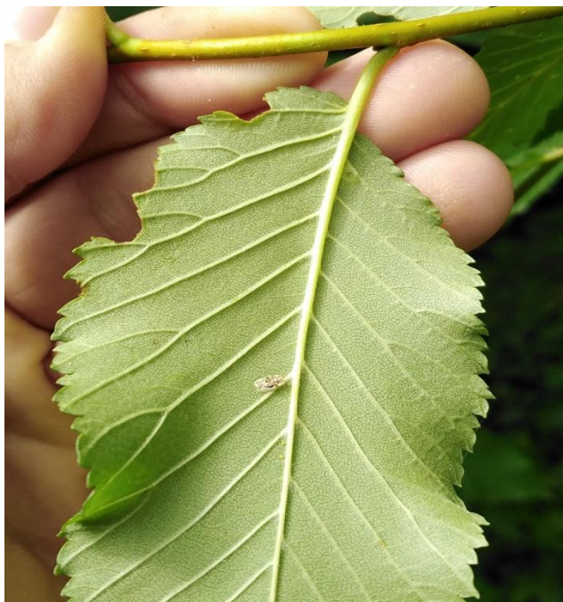
Slika 9. Imago stjenice na naličju lista poljskoga brijesta ( U. minor )