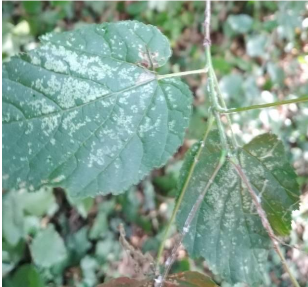
Slika 29. Kloroza na licu lista žestilja ( A. tataricum )