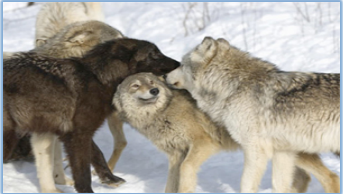
Slika 6. Hijerarhija (dominantnost/podložnost) u vučjem čoporu

slobodan od drugih vukova, te mladog vuka s kojim nisu u srodstvu, tada mogu zasnovati novi čopor (Poklar, 2013).