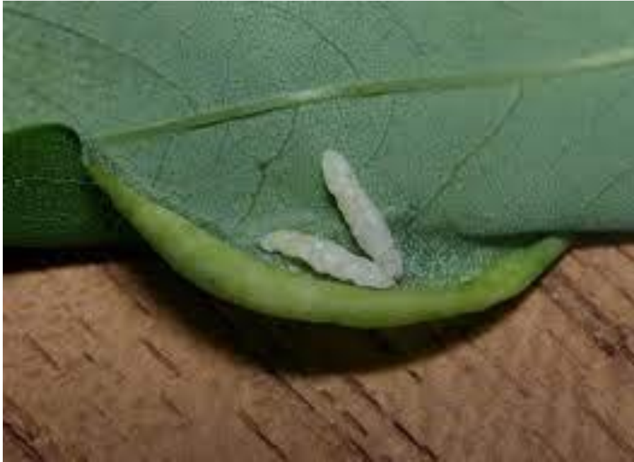
Slika 1. Ličinke bagremove muhe šiškarice ( Obolodiplosis robiniae ) na bagremu ( Robinia pseudoacacia ) i njihovo karakteristično uvijanje listova prema dolje