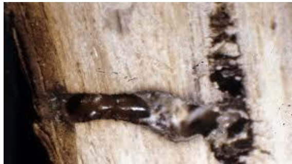
Slika 20. Na fotografiji vidimo karakterističan hodnik azijskog drvenara ( Xylosandrus germanus ) u obliku slova L

On ima zaobljeni protonum i pokrilje koje je za pola dulje od vratnog štita. (CABI, 2019) Pojavljuje se kao sekundarni štetnik na zdravim stablima, na odumrlim i oborenim. (CABI,2019) Ženka u hodnike unosi gljivice Ambrosiella hartigii i Ambrosiella grosmaniae . (Galko i drugi, 2018.) Te gljivice omekšavaju drvo i olakšavaju ovom štetniku bušenje hodnika.