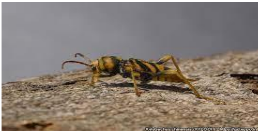
Slika 18. Na fotografiji je prikazan Xylotrechus chinensis u odraslom stadiju imaga na kori

Xylotrechus chinensis napada vrste iz roda Morus . Neke od tih vrsta su Morus alba L. i Morus nigra L. U Hrvatskoj je štetan za rodove Malus i Pyrus koji su bitni za šumske ekosustave. Ličinke u drvu buše hodnike i tako sprječavaju transport mineralnih tvari i vode s gornjeg dijela biljke u donji. Kako stablo otežano obavlja protok, ono počinje slabjeti. U daljnjem napredovanju ovog štetnika može doći do potpunog odumiranja stabla.