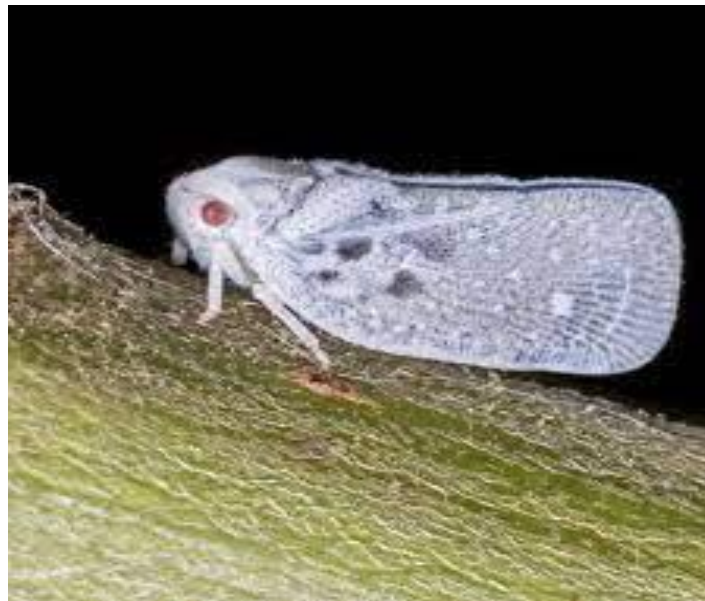
Slika 9. Medeći cvrčak ( Metcalfa pruinosa ) u odraslom stadiju

Napada brojne biljne vrste pa ga možemo opisati kao polifag. Na U kori, pukotinama i pupovima drveća i grmlja prezimljuju jaja. U drugoj polovici svibnja iz tih jaja izlaze ličinke. Na fotografiji 9. je prikazan medeći cvrčak u zadnjem, odraslom stadiju imaga. Na listovima se stvara siva do crna presvlaka i estetska vrijednost biljke se gubi. Neuredan izgled i bijele voštane prevlake (svlakovi ličinki na pupovima i donjem dijelu lista) obilježavaju jako zaražene biljke.