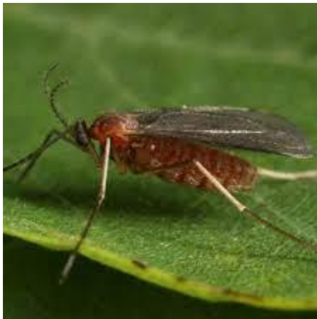
Slika 2. Odrasli stadij bagremove muhe šiškarice ( Obolodiplosis robiniae ) na listu bagrema ( Robinia pseudoacacia )