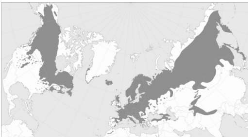
Slika 4. Prirodna rasprostranjenost Juniperus communis

Obična borovica je vrsta izrazito široke ekološke valencije te je najrasprostranjenija četinjača na Zemlji, čiji areal obuhvaća cijelu sjevernu polutku, tj. sjevernu Afriku, čitavu Europu, srednju i sjevernu Aziju i Sjevernu Ameriku (Slika 4). U južnoj Europi rasprostire se u brdskim područjima. U svojim zahtjevima na bonitet tla je veoma skromna. Osim toga, dobro podnosi ne samo niske zimske temperature, nego i ekstremne ljetne temperature (Herman 1971).