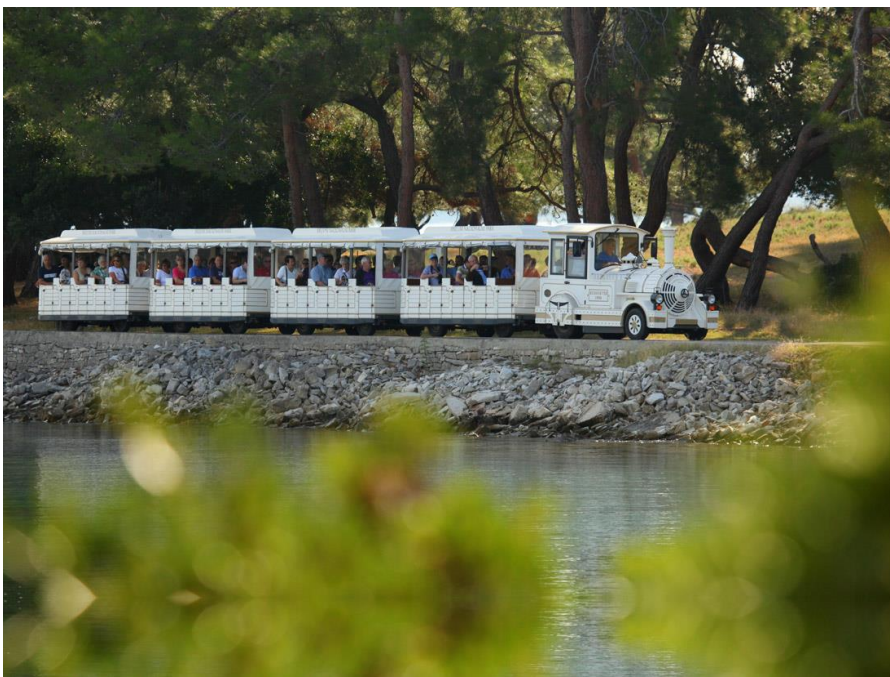
Slika 6. Električni turistički vlakić

Povoljan zemljopisni smještaj NP “Brijuni” omogućuje posjetiteljima dolazak u mjesto Fažanu korištenjem različitih vrsta prometa – cestovni, pomorski, željeznički i zračni, te se onda iz Fažane korištenjem brodica putuje do otočja. Na prostoru Nacionalnog parka “Brijuni” tijekom 20. Stoljeća izgrađeno je ukupno 274 km javnih prometnica, od toga 100 km internih cesta (asfaltnih i makadamskih) i 174 km uređenih posjetiteljskih staza. Postojećim asfaltiranim putovima odvija se promet turističkih posjetitelja izletničkim električnim “vlakovima”. Na obalama Brijunskog otočja uređeno je 10 lokaliteta (luka i pristaništa) za pristajanje brodova i drugih plovila. Glavna luka na Velikom Brijunu izgrađena je početkom 20. stoljeća u prirodnoj uvali, na prostoru nekadašnjeg teretnog pristaništa (za odvoz kamena i dr.). Rekonstrukcija je dovršena 1953. god. Ova luka predstavlja najbliži pomorski lučki objekt u odnosu na istarsku obalu i luku mjesta Fažana, i preko nje se odvija gotovo sav promet posjetitelja nacionalnog parka. Glavna teretna luka “Mletački kaštel”, uz uvalu Tore, služi za prihvat trajekata. Preko ovog mola na Brijunsko otočje stiže pretežni dio teretnog prometa (dnevna opskrba, građevinski materijali, komunalni servisi i dr.).