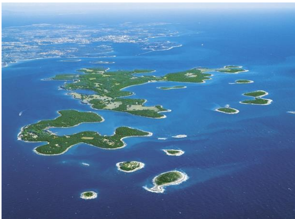
Slika 2. Pogled na NP Brijuni i Pulu iz zraka