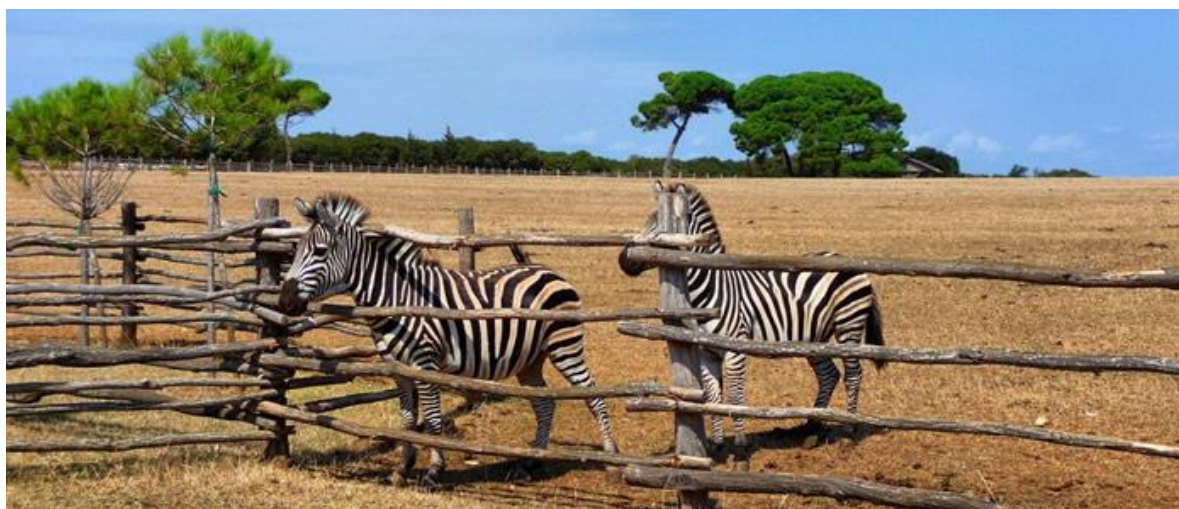
Slika 4. Safari park

Isključen je svaki ribolov i bilo kakvo korištenje podmorja, osim lova na plavu ribu. Ovo zaštićeno morsko prostranstvo nije izgubljena površina za ribolov, jer će more oko Nacionalnog parka time postati bogatije životinjskim vrstama.