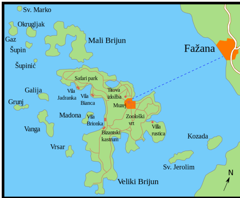
Slika 1. Pregled otoka i znamenitosti u NP Brijuni

Otoci imaju veliku pomorsku važnost. Naseljeni su već u prapovijesno doba, o čemu svjedoče kameni, koštani i keramički nalazi iz neolitika (4000. pr.Kr.) i eneolitika (3000. pr.Kr.). Gradine Velog i Malog Brijuna podigli su brončanodobni stanovnici (oko 2000. pr.Kr.) i Histri, (oko 1000. pr.Kr.). Gradinska (kasteljska) naselja, kiklopski zidovi na Gradini, tumuli, nekropole, ostatci gradina na Malom i Velom Brijunu svjedoče o naseljenosti otoka od ranoga brončanog do antičkog doba. Od 177. bili su u vlasti Rimljana pod nazivom Insulae Pullariae. Nakon propasti Zapadnog Rimskog Carstva u vlasti su Istočnih Gota (476. - 533.), zatim Bizanta do 776. godine. Neko su vrijeme bili pod Francima, potom (od 1230.) pod akvilejskim patrijarsima, a od 1331. vlast je imala Venecija. Tijekom stoljeća su zapušteni, a stanovništvo se iselilo zbog učestalih haranja malarije. Od 1806. su pod vlašću Austrije, odnosno Austro-Ugarske. Krajem 19. st. kupio ih je meranski industrijalac P. Kupelwieser i pretvorio u ekskluzivno ljetovalište. Uz turizam, otoci su bili dio obrambenog sustava puljske luke i Fažanskoga kanala, pa je na njima bilo izgrađeno sedam tvrđava, od kojih je najveća Fort Tegetthoff na brdu Vela straža. Talijanskom okupacijom Istre nakon I. svj. rata otočje gubi značaj mondenoga ljetovališta. Za II. svj. rata ondje je bilo sjedište talijanske vojno-pomorske akademije, potom časničko ljetovalište (odmorište za posade