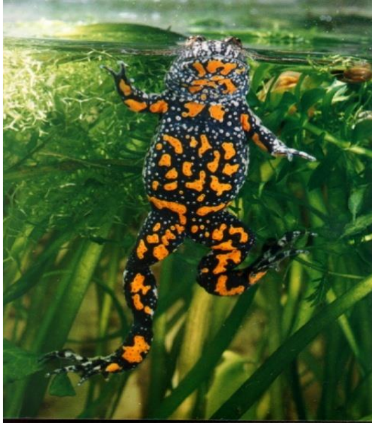
Slika 5. Crveni mukač Bombina orientalis