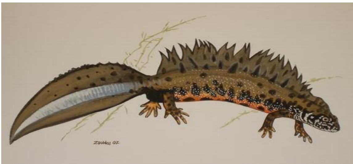
Slika 7. Veliki dunavski vodenjak Triturus dobrogicus