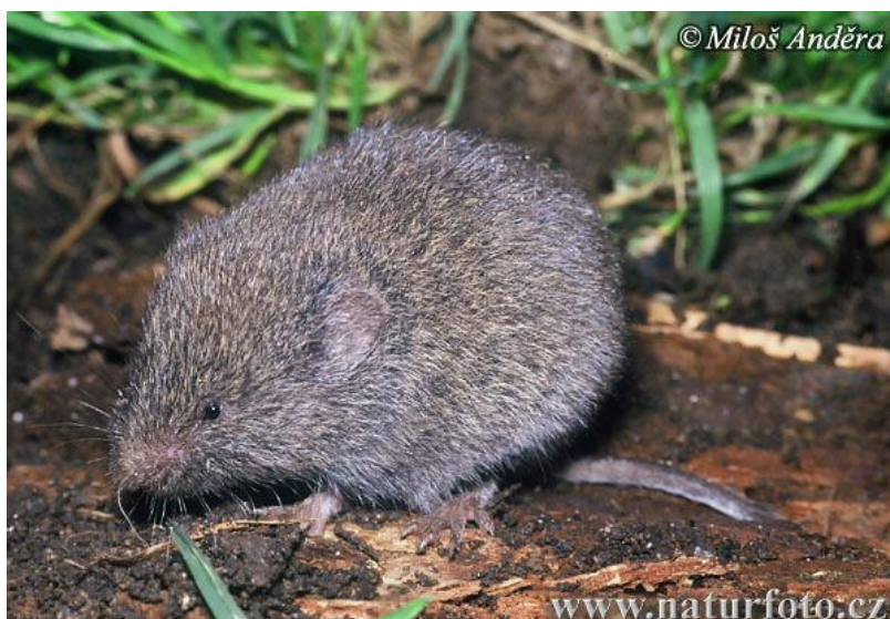
Slika 17. Podzemni voluharić u prirodnom okruženju