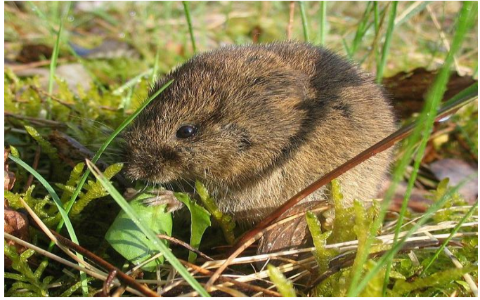
Slika 16. Poljska voluharica za vrijeme hranjenja