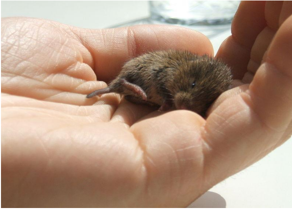
Slika 15. Poljska voluharica u ljudskoj šaci