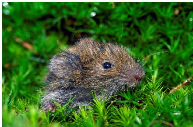
Slika 14. Livadna voluharica prilikom izlaska iz podzemnog hodnika