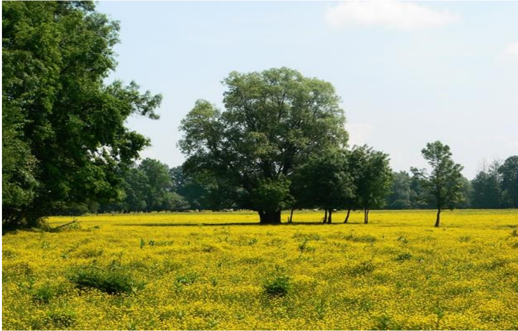
Slika 7. Sunjsko polje