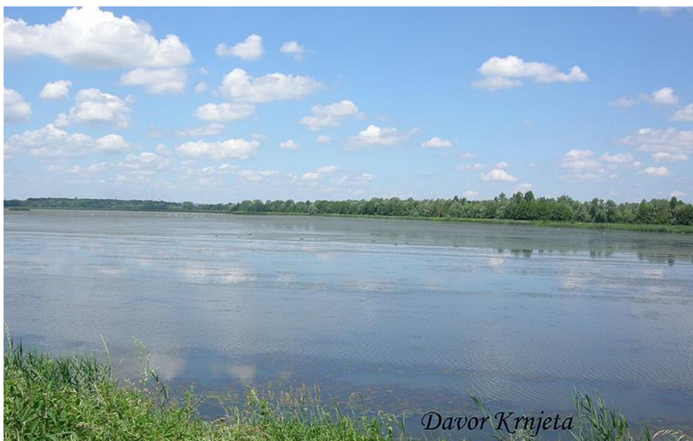
Slika 8: Ribnjak Lipovljani