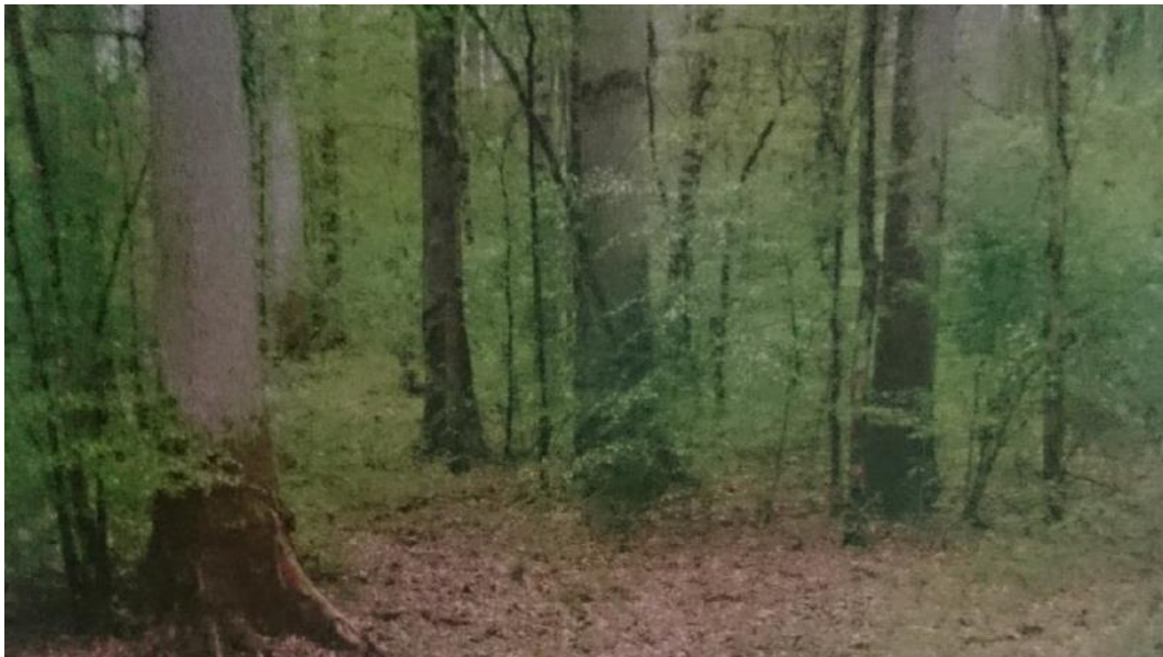
Slika 12: Šuma hrasta lužnjaka s velikom žutilovkom i rastavljenim šašem

nadovezuje izravno ili preko šume lužnjaka sa velikom žutilovkom i žestiljem. Važno je napomenuti kako je za ovu zajednicu ( Genisto elatae-Quercetum roboris subas. caricetosum remotae ) vrlo važna nadmorska visina terena, koja je od 80 do 85 m, a za pridolazak zajednice je vrlo bitan mikroreljef koji se povezan sa razinom podzemne vode koja je dosta visoka tokom cijele godine. Lužnjak se javlja u svim plohama te prevladava u subasocijaciji, još se ponegdje javlja vez ( Ulmus laevis ) i poljski jasen ( Fraxinus angustifolia ). Sloj grmlja je nejednako razvijen, negdje je vrlo slabo razvijen ili ga uopće nema pa u tom slučaju prevladava samo plava kupina ( Rubus caesius ), dok je na drugim mjestima u obliku pomlatka hrasta, brijesta i jasena. Od pravih grmova dolaze glogovi ( Crataegus monogyna i Crataegus oxyacantha ), velika žutilovka ( Genista tinctoria ssp. elata ), crvena hudika ( Viburnum opulus ), crni trn ( Prunus spinosa ). U sloju prizemnog rašća najznačajniji je rastavljeni šaš ( Carex remota ) i uskolisni šaš ( Carex strigosa ), zatim crijevac ( Cerastium silvaticum ), kiselica ( Rumex sanguineus ), plava kupina ( Rubus caesius ), vučja noga ( Lycopus europaeus ) i dr.