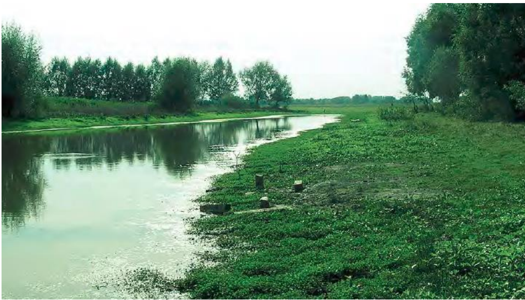
Slika 11. Površine obrasle zaštićenom vrstom „ Marsilea quadrifolia “

Ovo područje je poplavni prostor između rijeke Save i istočnog nasipa kod Slavenskog Broda, blizu sela Oprisavci. Važnost ovog područja predstavljaju prostrani vlažni travnjaci, stari rukavci sa bogatom vodenom i močvarnom vegetacijom te brojne aluvijalne depresije u kojima se redovnim proljetno-jesenskim poplavama zadržava voda i nakon povlačenja vode u Savu. Najveća od njih, Velika Gajna ima 5 ha i važno je područje za četverolisnu raznorotku ( Marsilea quadrifolia ), vrstu zaštićenu Direktivom o staništima.