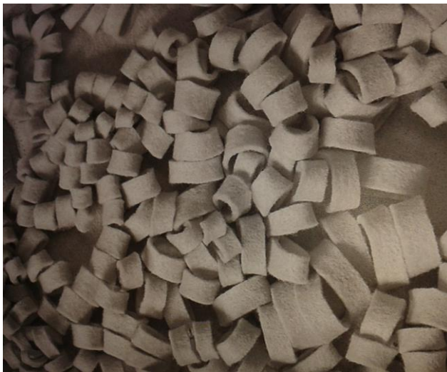
Sl. 10. the art of felt , autorica: Françoise Tellier-Loumagne (10.8. Gradska knjižnica, Starčevićev trg)

Filcanje je tehnika prerade vune koja se temelji na svojstvu vlakana da se uslijed mehaničkog i toplinskog djelovanja upletu u čvrstu strukturu. Vuna se nakon češljanja ne prede u nit, nego se moči vodom i sapunom, a zatim gnječi i valja. Na kraju se dobije gust i neraskidiv materijal - filc. Svojstva filca su toplinska i zvučna izolacija, teško je poderiv i može se precizno rezati. Dizajnerica i umjetnica Françoise Tellier-Loumagne istražuje dekorativni potencijal ovog praktičnog netkanog tekstila, a inspiraciju pronalazi u oblacima, zalascima sunca i nebu koje se stalno mijenja kako bi izradila originalne prostirke, tepihe ili sjenila za lampe. U knjizi the art of felt (Umjetnost filca) dizajnerica detaljno navodi uz svaku sliku tehniku izrade pojedinog predmeta pri čemu joj nebo i njegove promjene službe kao inspiracija [3].