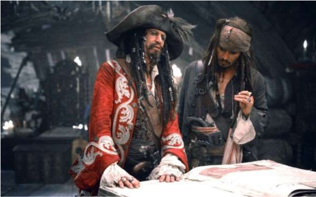
Slika 3.: Keith Richards i Johnny Depp na snimanju filma 2007.

No nije filmska industrija jedina koja je inspiraciju pronašla u Richardsovom stilu. Keith je 2008. godine postao zaštitno lice Louis Vuittona.