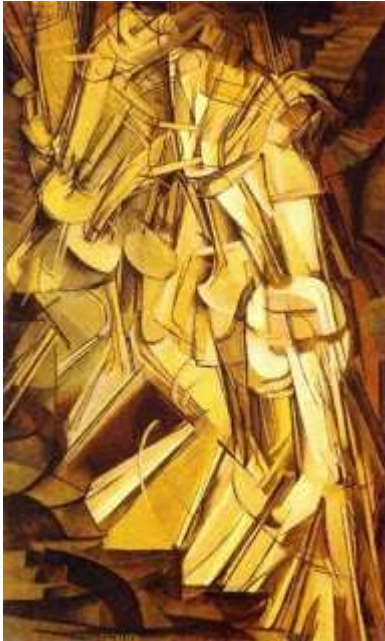
Slika 10. Marcel Duchamp, Akt silazi niz stepenice (1912.)

ogromno apstraktno djelo koje se sastoji od cilindričnih i stožastih elemenata za koje se čine da se kreću po prostoru, ali nam ne daju pojam u odnosu na spol, dob, individualnost ili karakter subjekta.