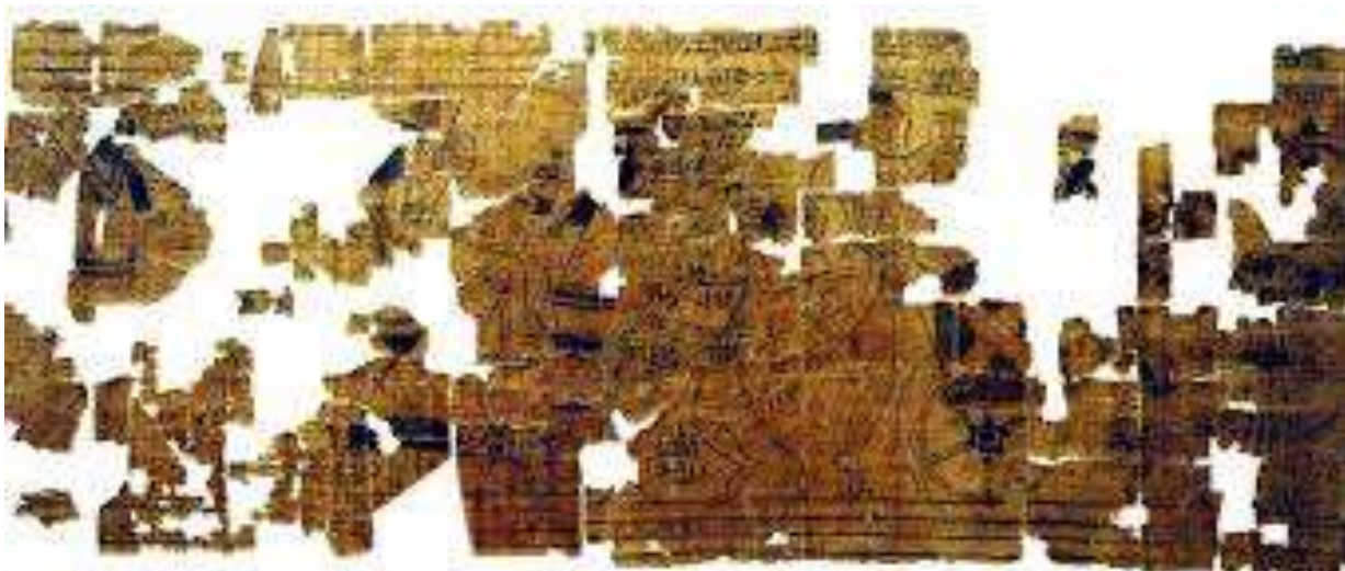
Slika 19. Erotic and Satirical papyrus, Der el-Madina (1186-1070 Pr. Kr.)

Rekreacija nagog ljudskog tijela u umjetnosti zahtjeva od gledatelja da svjesno ili subjektivno odluči je li to u dobrom ili lošem ukusu, što vrijedi i kako ocjenjujemo umjetnost općenito. Seksualno uzbuđenje ne mora biti jedina namjera pornografije, ali smatra se da je to njegova središnja ili krajnja namjera. Sa biblijskog stajališta, možemo se osvrnuti na Pavlovu poslanicu Rimljanima: