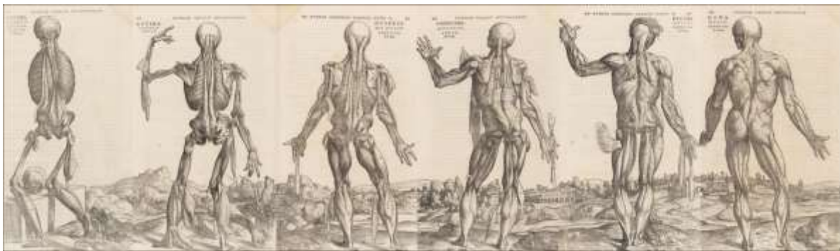
Slika 11. Andreas Vesalius, 1543

Razlika između njih dijelom je samo pitanje terminologije i naglaska na koncept “nagost i razborit“, Graves se protivi “gol i neosramoćen“. S druge strane konceptu “gol i neugodan“ Clark se protivi “gol i objedinjen umjetničkom idejom“. Njihove sličnosti mogu biti jasnije s detaljnijim analizom Gravesove pjesme, s mogućnošću da se pjesnik mogao povjeriti povjesničaru umjetnosti ne samo na početnu katalitičku simulaciju ali i za neku intelektualnu razinu njegove pjesme. Na kraju, podudarna podudaranja između njihovih stavova je izuzetna.