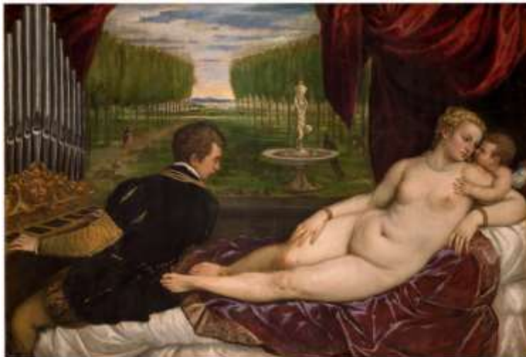
Slika 2. Titian, Venus with an Organist and Cupid (1555.)

“ Venera i glazba “ je odličan primjer za to. Žena leži gola na kauču dok glazbenik svira. Te dvije figure su odvojena jedna od druge, ali orguljaš gleda u Veneru tražeći “ljubav i ljepotu“ za inspiraciju u njegovoj glazbi. Upravo ta simbolika čini ove slike smislenima. Ona je muza. Nije žena upitne podobnosti jer nije stvarna. Umjesto toga, ona predstavlja nešto uzvišeno i pruža način čovjeku da promišlja ljudske vrijednosti i istinu.