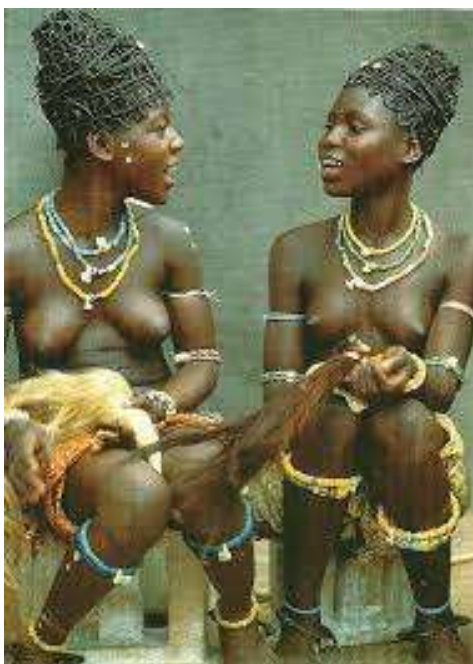
Slika 12. 'Dipo' žene

Prema Kennedyju ideja pornografije je nešto što je čovjek stvorio, nije nešto što je proizašlo od našeg Stvoritelja, iako su mnogi kršćani vjerovali i propovijedali.