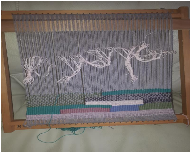
Slika 6. Izrada tapiserije