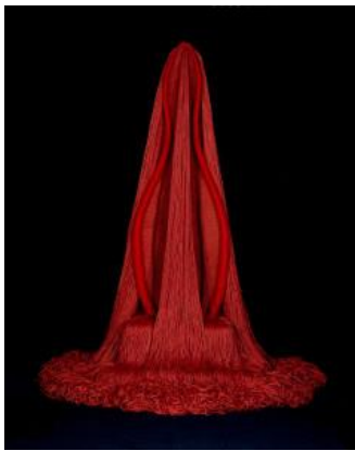
Sl. 5. skulptura Red Preview (Crveni pregled) koju je Zeisler izradila 1969. (Wikipedia 11.8.)

dekoracije. Usporedno s podizanjem srednjovjekovnih burgova i kaštela, a od renesanse i dvoraca, potražnja za tapiserijama neprestano je rasla. Njima su se prekrivale zidne plohe, ali i kreveti, sjedala, vladarska prijestolja, vješale su se na prozore, vrata, oko kreveta [4]. Između dva svjetska rata tkalci tapiserija doveli su u pitanje podjelu na lijepe umjetnosti i tekstil. Nakon Drugog svjetskog rata bilo je puno tapiserija umjetničkog dizajna (Matisse, Miró, Picasso). Iako su slike ključne za tkalce tapiserije, uz vlakna i boje također je postao važan i oblik [1]. Tako su nastale ambijentalne skulpture tapiserije Claire Zeisler.