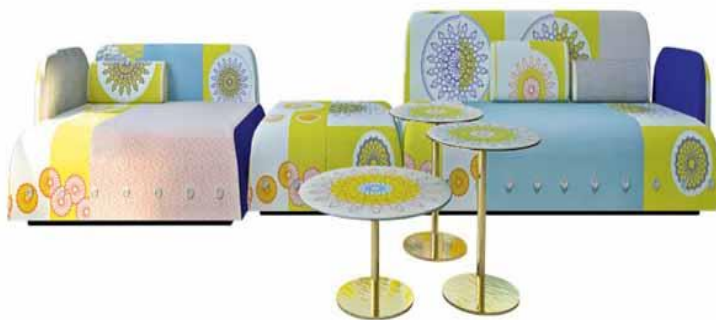
Sl. 2. Naslov članka: Modern vintage furniture (Moderan vintage namještaj), slika s portala decor4all (19.8.2010)

prostoriji s malo danjeg svjetla koristiti svjetlije boje, a presvlake moraju biti usklađene s ostalim bojama namještaja. Odabirom teksture postiže se određeni vizualni, ali i taktilni 2 dojam, na primjer mekoća ili dojam luksuza. Uzorak tkanine predstavlja vizualni raspored elemenata i motiva na površini. Uzorak može biti rezultat strukture vlakna ili može biti otisnut na površini. Uzorak bi trebao biti usklađen s ostalim elementima u prostoriji te s veličinom prostora. Veliki uzorci s pokretom obično izgledaju dobro na prozorima, međutim nisu uvijek najbolji odabir za tapecirani namještaj [2] .