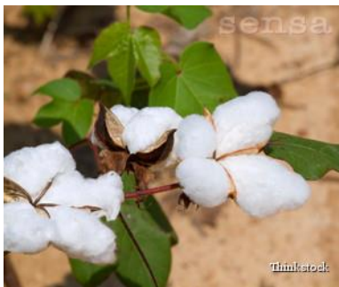
Slika 11. Plantaža pamuka (izvor: http://www.sensaklub.hr/clanci/zeleni-savjeti/fairtrade-postovanje-ljudskih-prava?page=2 ) od 20.8.

Pravedna trgovina naročito je važna u tekstilnoj industriji jer se većina tekstila proizvodi u siromašnim zemljama zbog vrlo niskih troškova proizvodnje, odnosno jeftine radne snage. Osim toga, na plantažama pamuka poštuje se zaštita okoliša pa je sigurno da dobivena tkanina ne sadrži nedopuštene pesticide. Dakle, za cijenu koju plaća Fairtrade traži i određenu kvalitetu.