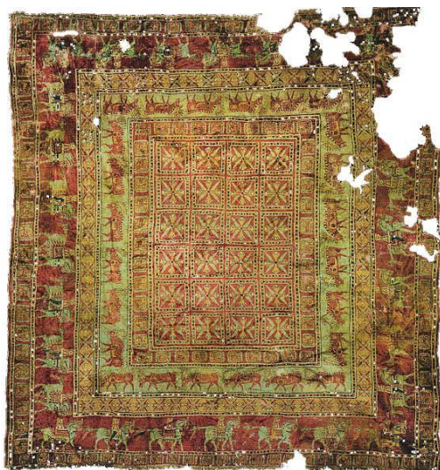
Sl. 3. Tepih od meke vune u Pazyryku [1] 58.str.

Tepisi koji se izrađuju za komercijalnu uporabu moraju biti izdržljivi, gusti, niske flore, od poliamidnog vlakna. Dok tepih u kući osigurava toplu i ugodnu atmosferu, tepisi u poslovnim zgradama šalju određenu poruku o kompaniji. Osim toga, tepih služi i kao toplinska i akustička izolacija, koji su u skladu sa standardima. Tako u Europskoj uniji od 2007. godine prodaja tepiha mora ispunjavati zahtjeve u pogledu zdravlja, sigurnosti i štednje energije propisane Direktivom o građevinskim proizvodima.